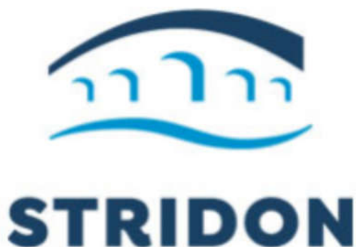
Slika 2 Logotip „Stridon prometa“

Na slici 2. prikazan je logotip „Stridon prometa“.