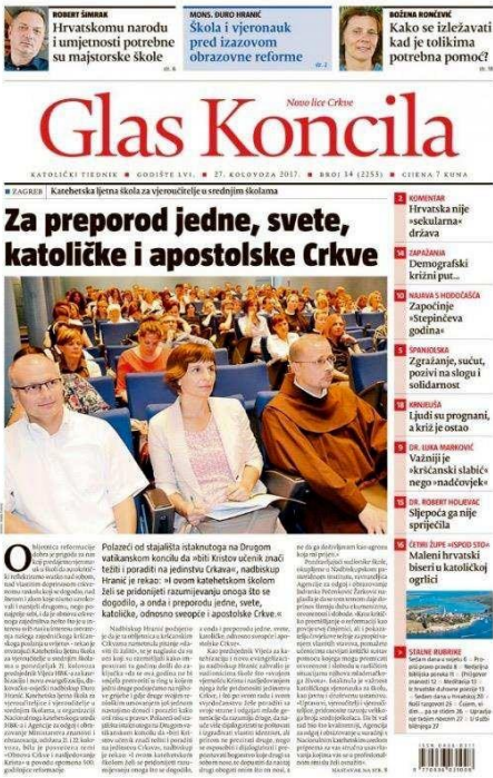
Slika 3