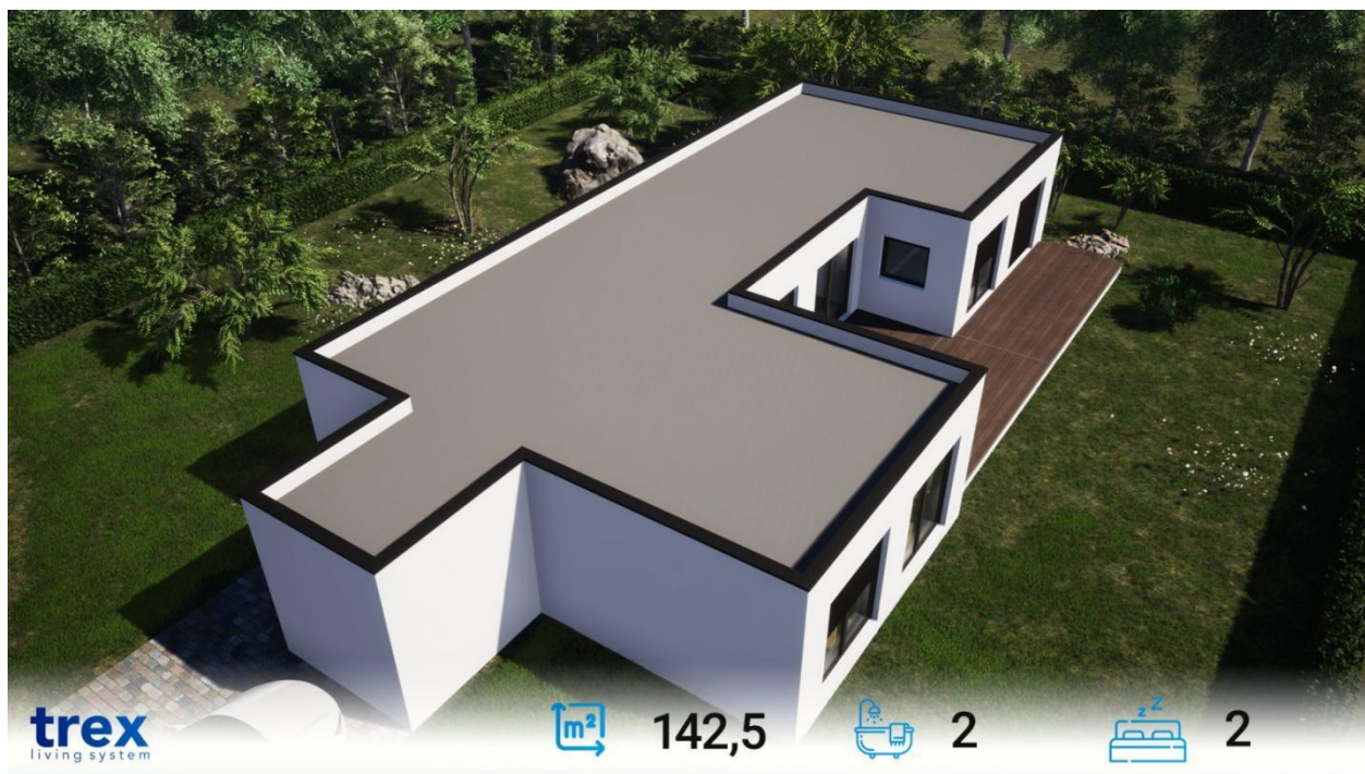
Slika 2. TREX Family 142,5+ B