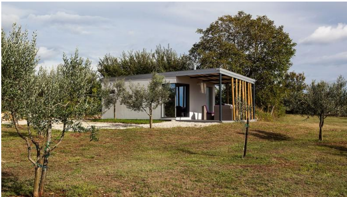
Slika 1. Mobilne kuće okružene maslinikom