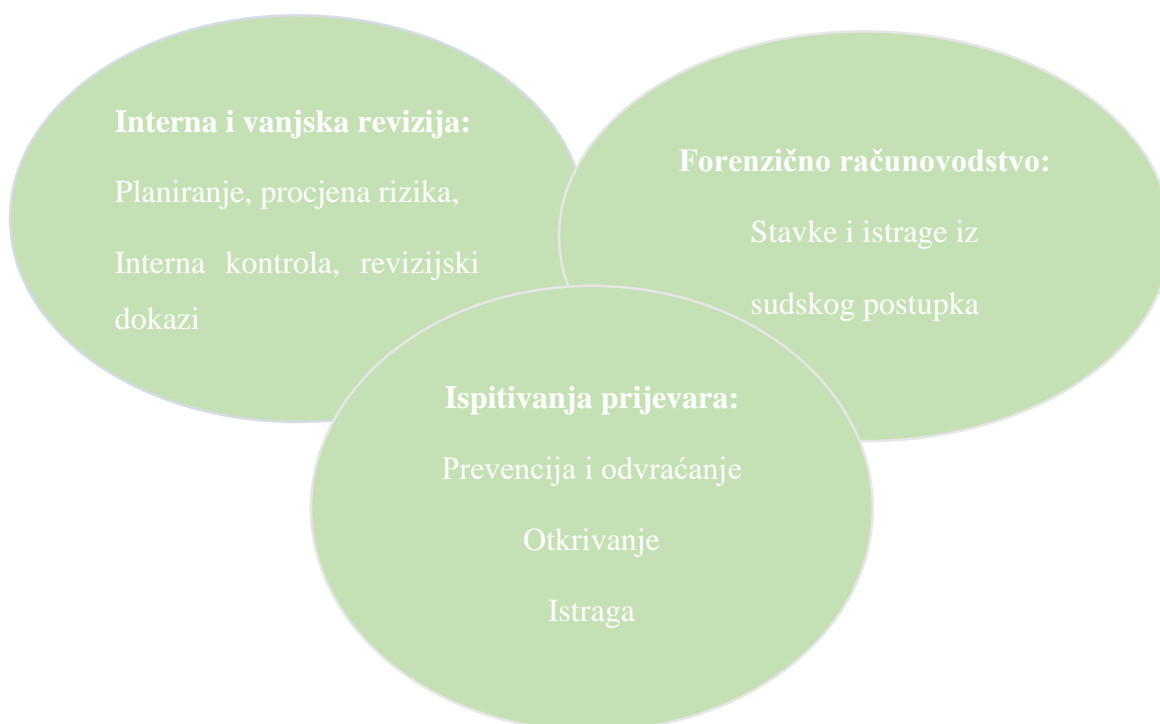
Slika 3. Prikaz međuodnosa revizije, forenzičnog računovodstva i ispitivanja prijevvara

beskrupulozni pojedinci opljačkali nedužne investitore, uništili gospodarstvo, ljudima oduzeli radna mjesta.