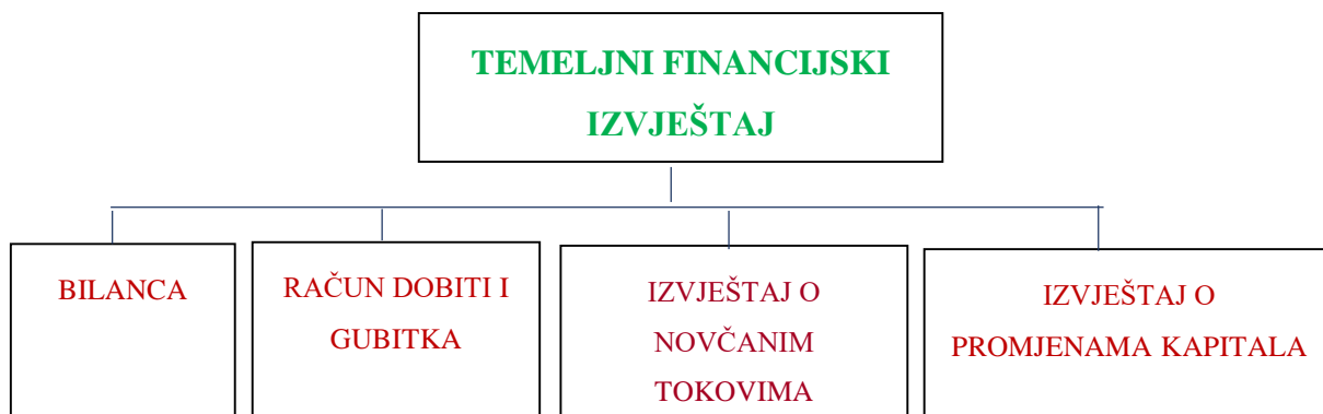
Slika 2. Prikaz sheme temeljnih financijskih izvještaja