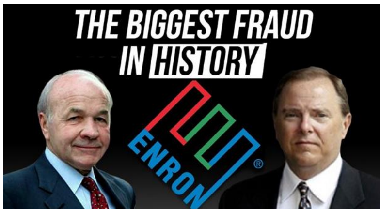
Slika 4. Logo poduzeća Enron- Kenneth Lay & Jeffrey Skilling