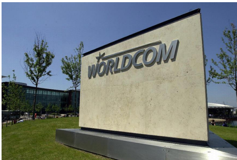
Slika 6. Logo velike korporacije WorldCom