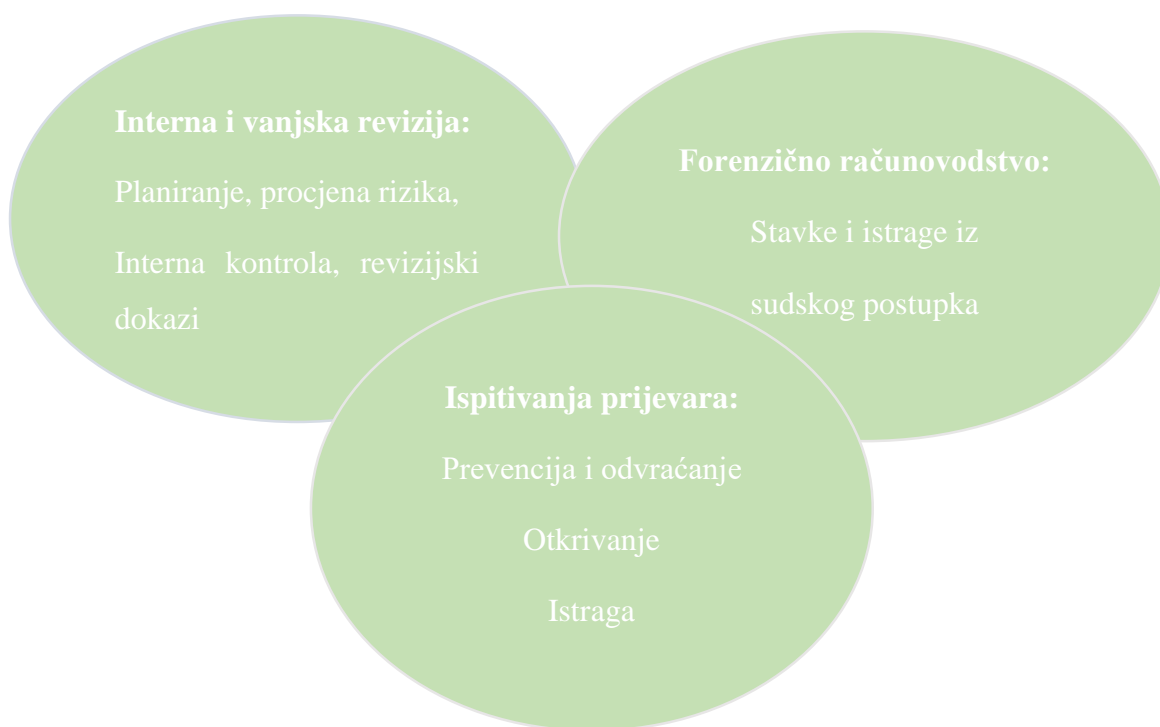
Slika 3. Prikaz međuodnosa revizije, forenzičnog računovodstva i ispitivanja prijevvara

beskrupulozni pojedinci opljačkali nedužne investitore, uništili gospodarstvo, ljudima oduzeli radna mjesta.