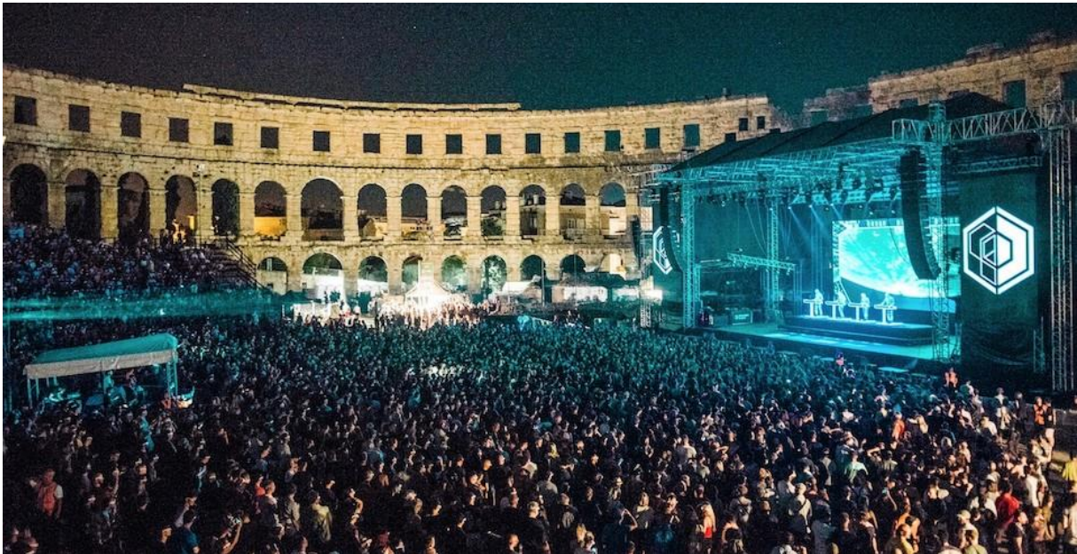
Slika 2: Otvorenje Dimensions festivala u pulskom amfiteatru (Rob Jones, 2019)

Ova dva festivala su 2021. preseljena na novu lokaciju, a bit će obrađena kasnije u radu kroz detaljnu analizu drugih festivala u RH. No, prava je šteta za turizam Pule i poluotoka Štinjana da radi nedovoljne potpore lokalnih vlasti, ovakvi megalomanski festivali odsele iz Pule jer su upravo spomenuti festivali bili zaslužni za produljenje turističke sezone s obzirom na termine svojih održavanja, od sredine kolovoza do početka rujna. Činjenica jest da Pula do dolaska festivala nije bila jedan od prepoznatih centara za turizam kao što primjerice Istra jest, a Outlook festival je to uspio napraviti od Pule unazad 10 godina.