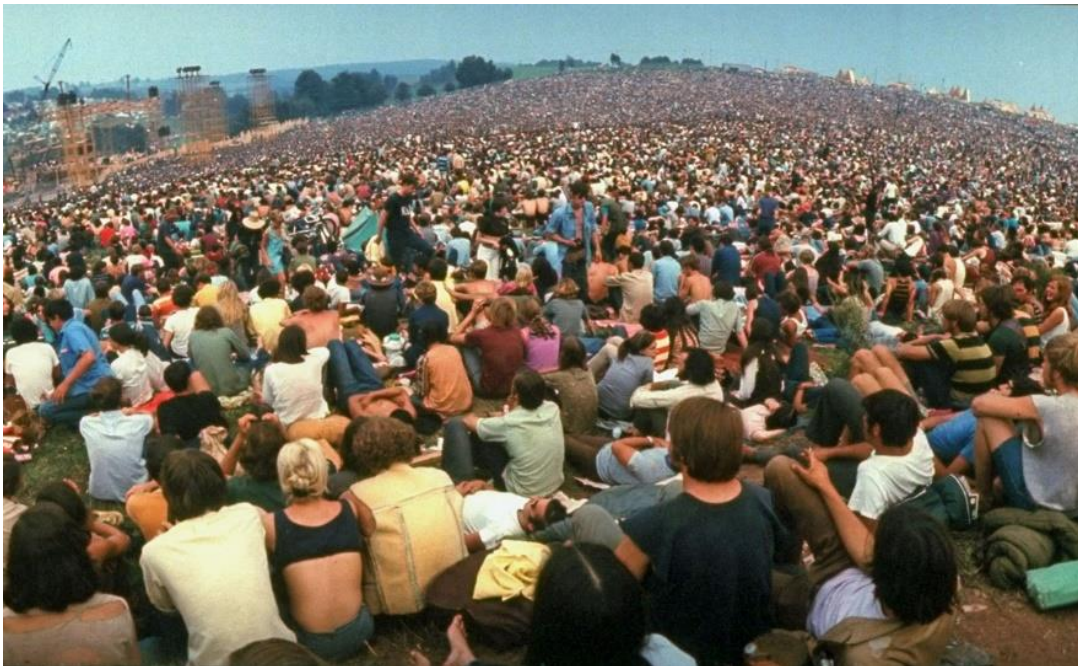
Slika 1: Woodstock Festival 1969. godine (John Dominis)

Tako primjerice u Hrvatskoj već imamo razvijeni glazbeni festivalski turizam u Puli, Splitu i Tisnom koji su u svijetu prepoznati kao aktualne glazbene festivalske lokacije, no to će biti detaljno obrađeno unutar idućeg poglavlja rada u kontekstu festivala elektroničke glazbe kao važnog segmenta turističke ponude.