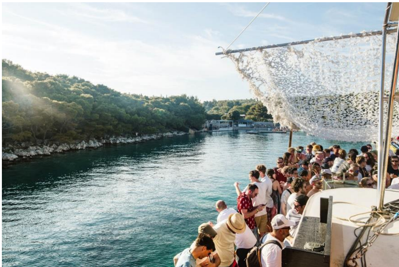
Slika 5: Boat party u sklopu Love International festivala (Rob Jones, 2019)

Izvor: https://loveinternationalfestival.com/