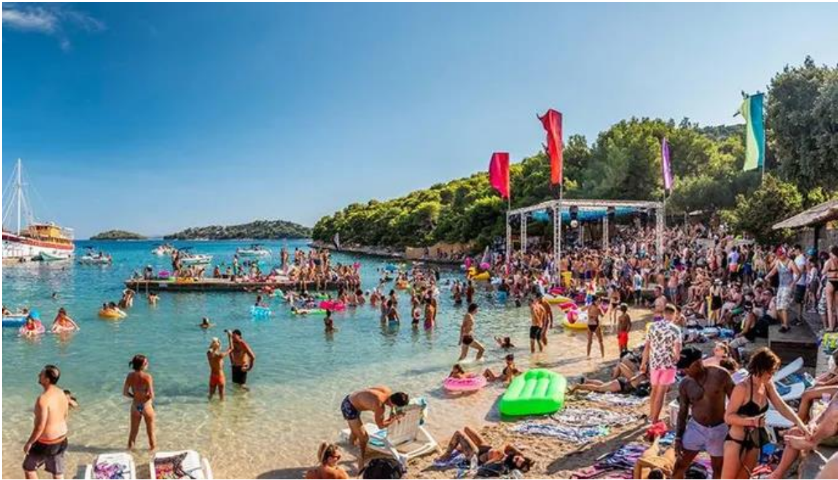
Slika 4: The Garden Resort Tisno, Defected Festival (nepoznati autor)

Izvor: https://www.festicket.com/festivals/defected-croatia/