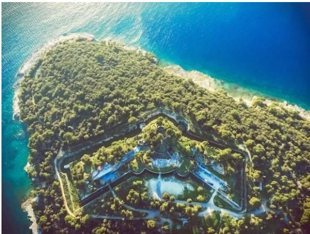
Slika 3: Tvrđava Punta Christo, slika iz zraka (Danijel Kršić, 2017)

Izvor: http://seasplash-festival.com/hr/summer-club/otvorenje-sezone-2018-tvrdavi-punta-christo/