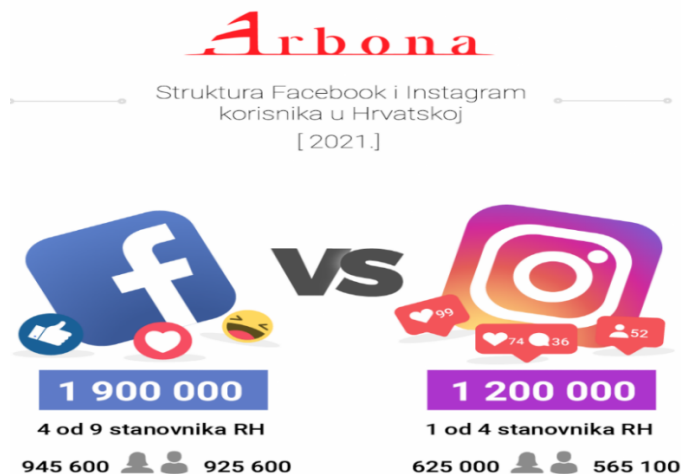
Slika 3 Struktura Facebook i Instagram korisnika u RH (2021.)

Izvor: https://profitiraj.hr/struktura-facebook-i-instagram-korisnika-u-hrvatskoj-u-2021-godini/ (dostupno: 19.04.2022.)