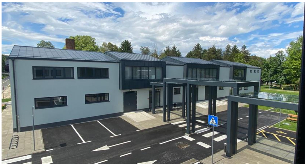
Slika 2 Primjer poslovnog inkubatora, Mali Tehnopolis Samobor