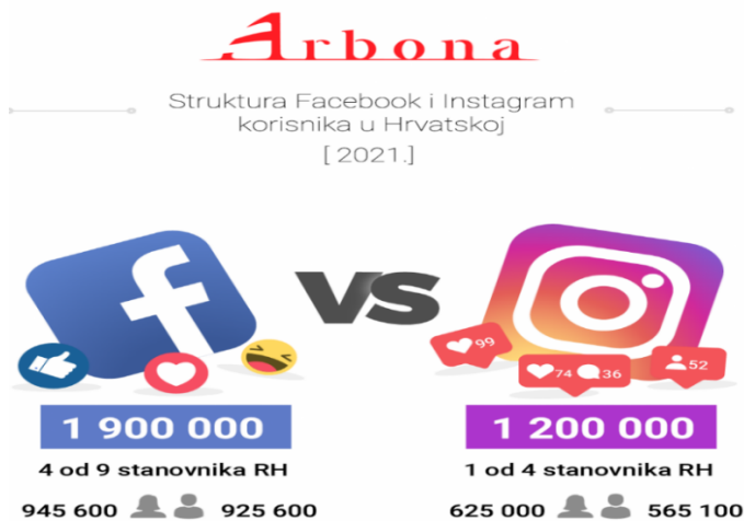
Slika 3 Struktura Facebook i Instagram korisnika u RH (2021.)