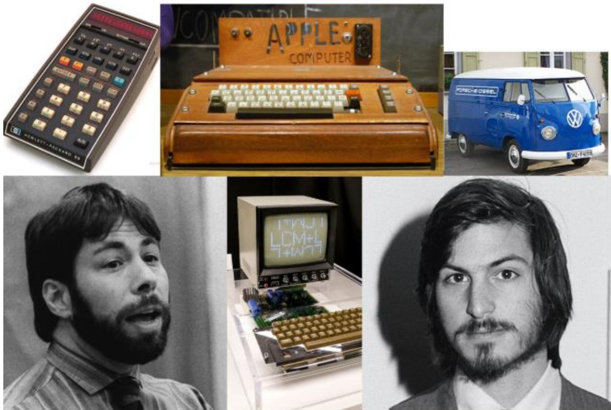
Slika 1. HP-65 kalkulator, Steve Wozniak, Apple 1, VW Microbus i Steve Jobs

U nastavku rada slijedi slika Apple 1 računala kao i prodanog kalkulatora i Volkswagena. na slici su također Steve Wozniak i Steve Jobs.