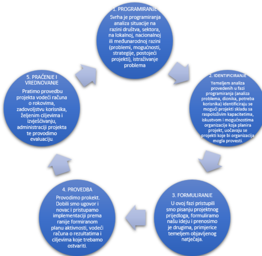
Slika 2 SHEMATSKI PRIKAZ FAZA PRAĆENJA