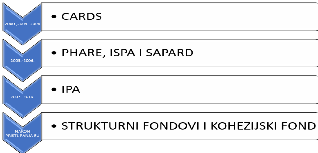
Slika 1: Komponente IPA programa