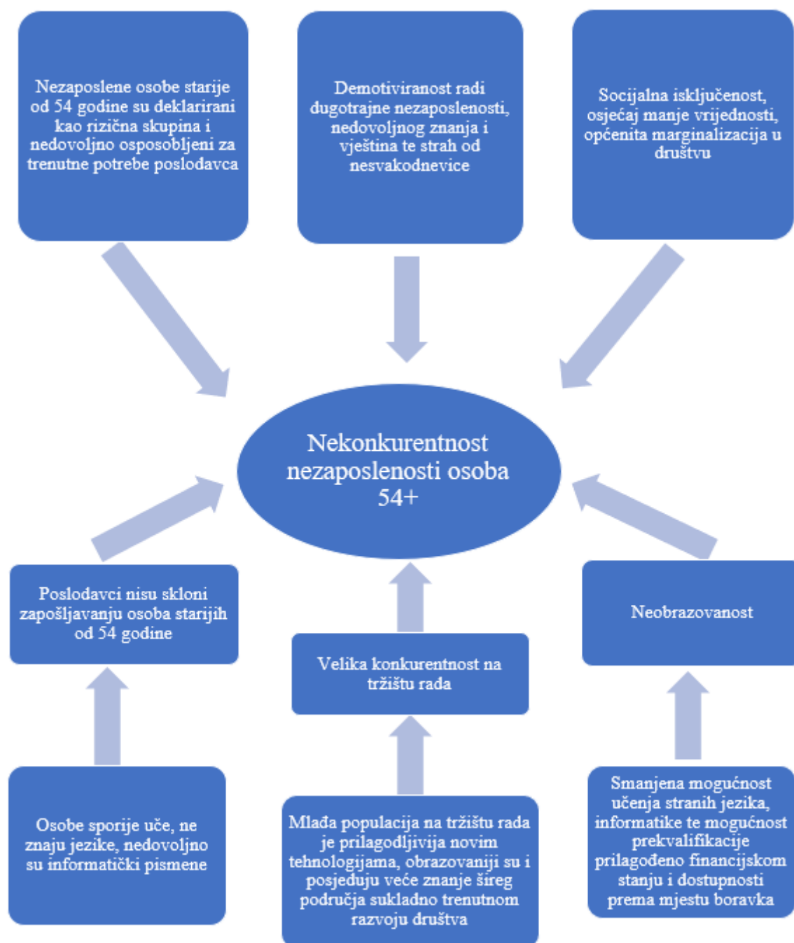
Slika 3 Analiza problema