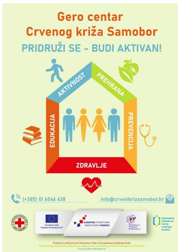
Slika 7. Plakat projekta Gero centar Crvenog križa Samobor