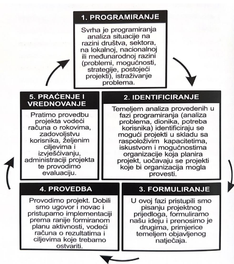
Slika 3. Shematski prikaz projektnog ciklusa