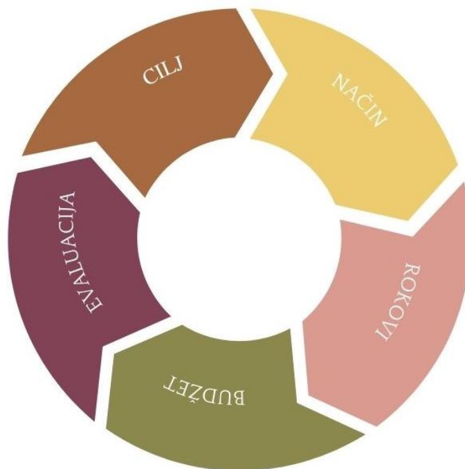
Slika 4. 5 pitanja diseminacije