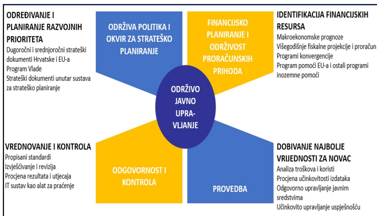
Slika 1. Očekivani učinci uspostave sustava strateškog planiranja

Strateško planiranje svoje početke nalazi u privatnom sektoru, ali isto tako treba se provoditi na lokalnoj, regionalnoj i nacionalnoj razini jer predstavlja ključni dio uspješnog upravljanja i ciljnog razvoja javnog sektora, a na kraju i položaja i stanja u državi. 2