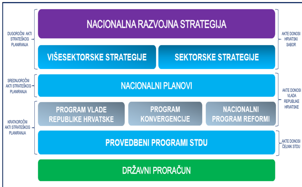
Slika 2. Sustav akata strateškog planiranja na nacionalnoj razini

u desetogodišnjem razdoblju. 6 Posebni propisi ili obvezujući pravni akti uvjetuju izradu sektorske i višesektorske strategije. Za izradu strategije zaduženo je tijelo državne uprave nadležno za oblikovanje i provedbu javne politike u upravnom području za koje se izrađuje strategija. Sektorske i višesektorske strategije na rok važenja od najmanje 10 godina donosi Hrvatski sabor.