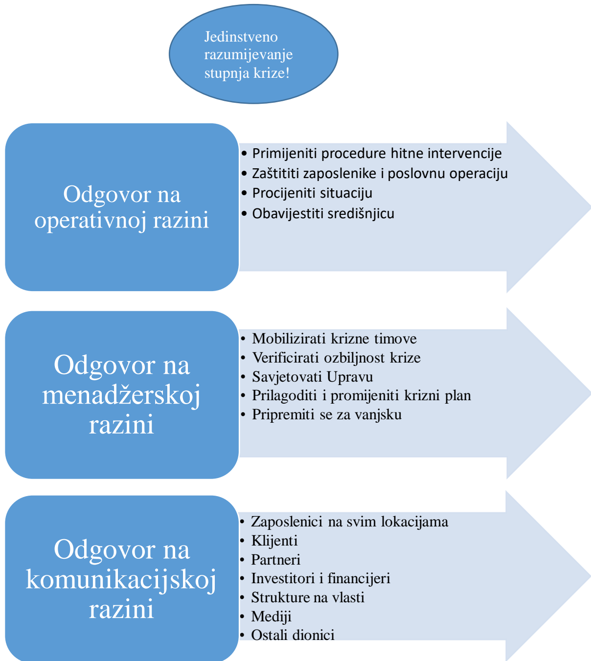
Grafikon 1 Razine odgovora na krizu

Izvor: Tafra Vidaković (2011:106) Upravljanje Krizom Procjene, planovi, komunikacija