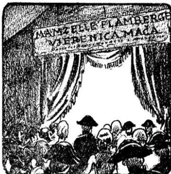
244. Najveća senzacija velikog sajma St. Germaine u Parisu bila je mamzelle Flamberge, djevojka nepobjediva na maču...