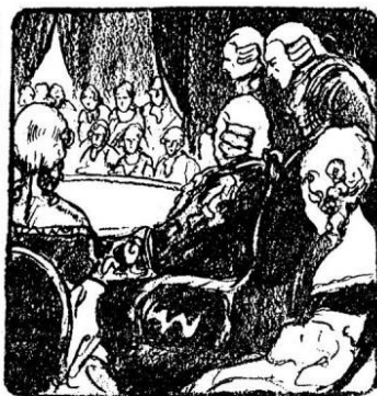
248. Slava gospođice Flamberge proćula se po cijelom Parisu. Na kraju je došao i sam kralj s cijelim svojim dvorom, da se uvjeri o njezinoj vještini.