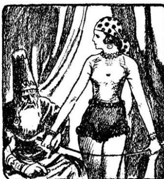
245. Uz nju se prikazivao radoznoj publici i vrač Lanlire, koji je posjetiocima proricao budućnost.