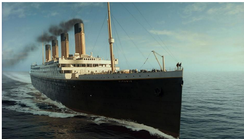
Slika 4: Scena iz filma Titanic