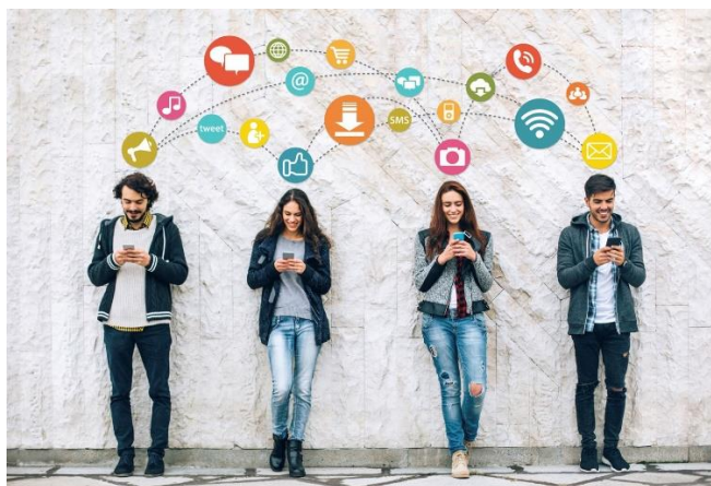
Slika 5: društvene mreže

Društvene mreže su najpopularniji globalni komunikacijski fenomen jer je čovjek društveno biće i jer ga društvena komunikacija privlači i zanima. Na društvene mreže dolazimo kako bise zbližili, povezali sa prijateljima, stekli nova prijateljstva, odnosno kako bismo podijelili ili primili razne informacije. Ovakve mreže, pored prvobitne uloge komunikacije, imaju i ulogu marketinga promovirajući druge web stranice i niz različitih usluga. Na društvenim mrežama možemo komunicirati na mnogo različitih načina, od chattanja odnosno čavrljanja do razmjena slika ili videa. Među najpoznatijim modernim sustavima za komunikaciju na internetu su: Facebook, Instagram, YouTube, LinkedIn, Twitter, Skype i dr. Danas u svijetu postoji više od 100 društvenih mreža, odnosno web stranica, koje nude različite usluge, jedno im je zajedničko: povezuju ljude istog interesa širom svijeta na sasvim nov i moderan način.