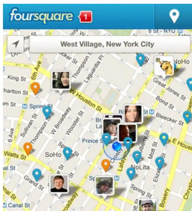
Slika 6: Foursquare

Danas se gotovo sve može objaviti ili komentirati na internetu i nije moguće zaustaviti loše kritike. Ono što možemo napraviti je prihvatiti kritike i poboljšati komunikaciju s korisnicima. Osluškujući želje možemo unaprijediti proizvod ili uslugu koju nudimo. Kritika ne mora uvijek biti loša stvar koja se dogodila. Zahvaljujući takvoj funkciji velikog vala, možemo unaprijediti sebe i u kratkom roku i sa minimalnim troškovima možemo stvoriti određenu količinu korisnika koji su nam dovoljni za ostvarenje željenih ciljeva.