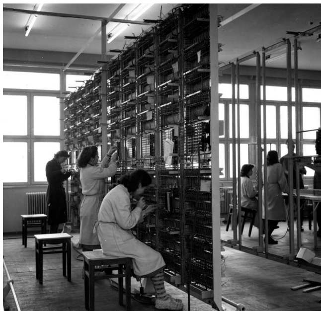
Slika 3: Telefonska centrala