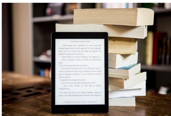
Slika 2: Elektronička knjiga

Već smo ranije spomenuli da je izumom prvog tiskarskog stroja, 1455. godine, Guttenberg tiskao prvu Bibliju. To je prva tiskana knjiga u svijetu. Najveći porast tiskanja knjiga u svijetu događa se nakon 2. svjetskog rata i ekonomskog procvata. Danas je sve manji broj tiskanih knjiga jer razvojem tehnologija su sve popularnije elektroničke verzije knjiga. Zbog svoje pristupačnosti, jednostavnosti nabavke knjige i znatno niže cijene u odnosu na standardne knjige, prodaja elektroničkih verzija knjiga bilježe sve veći porast.