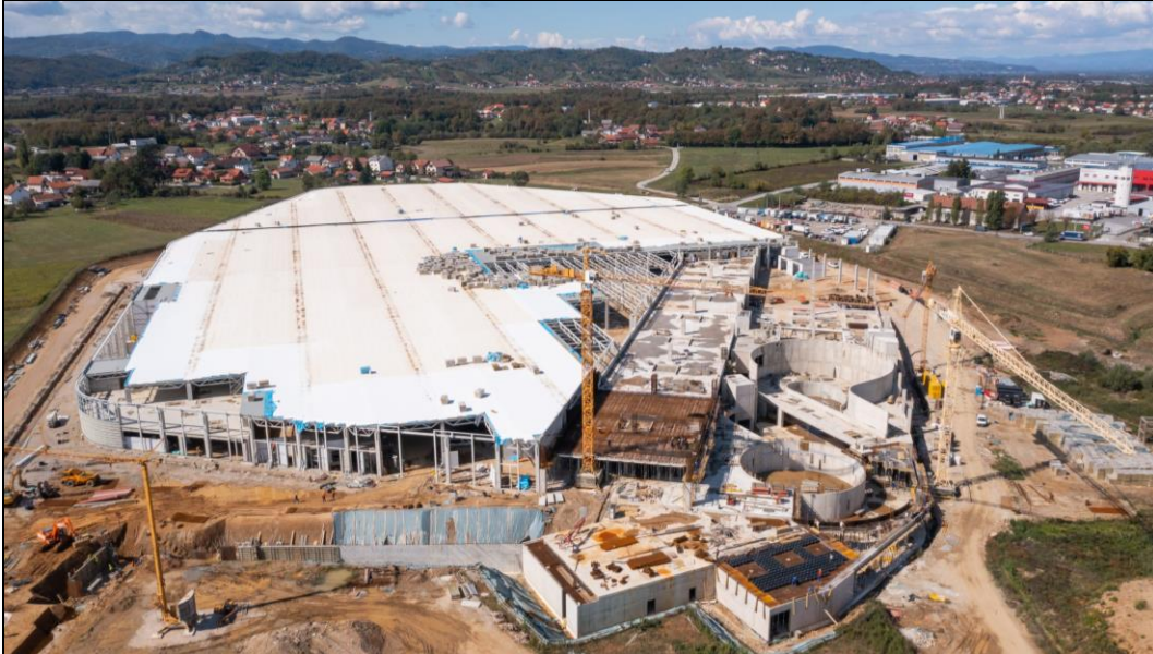
Slika 4 Proces izgradnje Rimac Campus