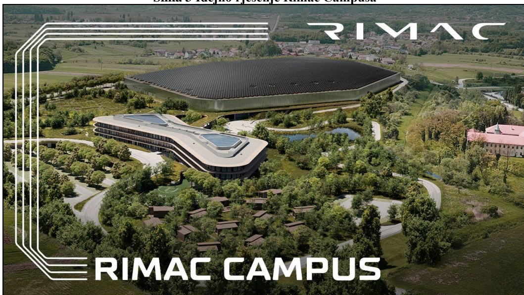
Slika 3 Idejno rješenje Rimac Campusa