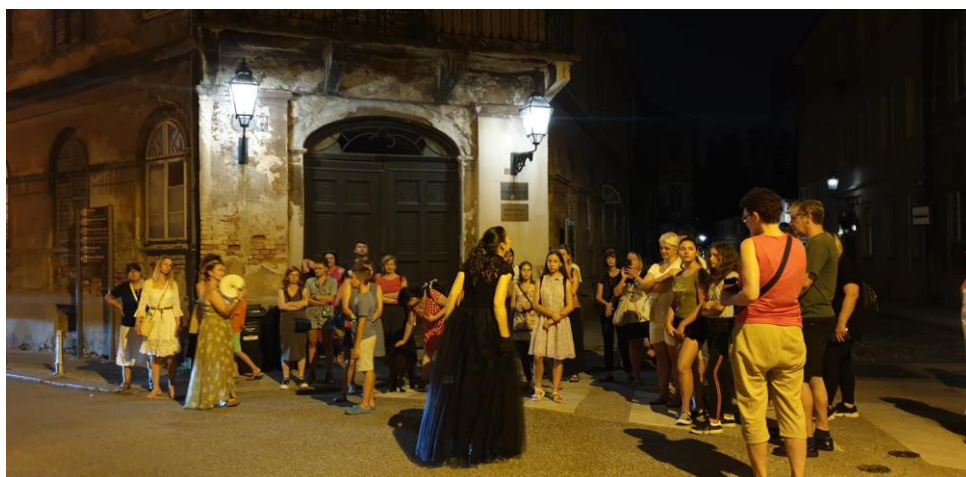
Slika 12. Purgerica i začarane priče

Sudionici imaju priliku sudjelovati u interaktivnim dijelovima ture te čuti o legendama grada i seoskim običajima poput pletenja cvijeća, druženja mladih oko vatre i pripovijedanja priča o gradu koji spava između dvaju zmajeva - Medvednice i Save. Tura je temeljena na djelima Zdenka Bašića, Ivane Brlić Mažuranić, Denivera Vukelića i Vida Baloga, koji istražuju hrvatsku mitologiju i bajoslovlje. 25