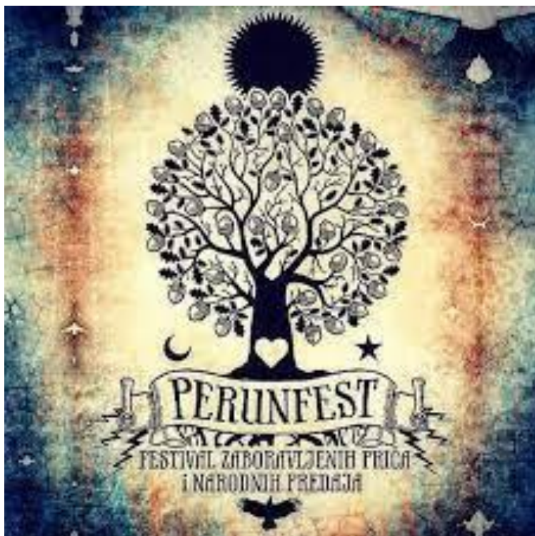
Slika 4. Vizualni identitet Perunfesta

Na dnu ispod korijena svijeta stoji sakrivena Mokoš (u obliku zimske vrane); majka Peruna i baka mladog božanskog para Jurja i Mare; predstavlja zemlju, majku; ona koja život daje, ali život i oduzima; svoj oblik mijenja od živog proljeća kada izlijeće na vrh hrasta/Stabla Svijeta, do strašne zime kada leti nad zemljom i klopoče kljunom dok nosi smrt, ali štiti sve sjemenje pod zemljom, kreativnost i sve novo što tek dolazi. 13