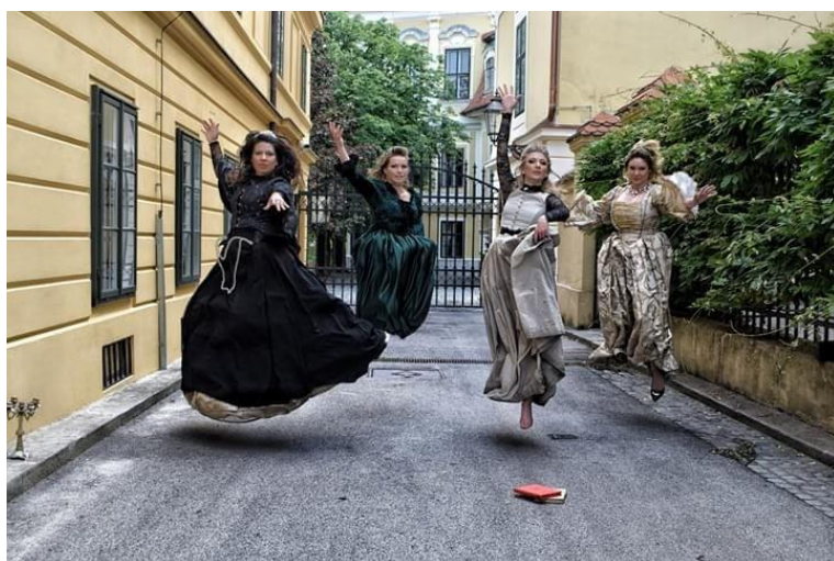
Slika 11. Gornjogradske coprnice

Gornjogradske čarolije su iznimno uspješan projekt male tvrtke Omnes artes d.o.o., koja se bavi izvedbenom umjetnošću. Slogan tvrtke sadržan je u samom nazivu i predstavlja raznolikost svih umijeća koje najbolje prikazuju projekti poput Gornjogradskih čarolija, Iz Zagorkina pera i najnovijih Neznanih junakinja. Projekt Gornjogradske čarolije postoji od 2013. godine, a počeci su bili skromni. Ideju je pokrenula tvrtka Omnes artes uz podršku Muzeja grada Zagreba i Turističke zajednice grada Zagreba. U početku su obilasci održavani tijekom dana, bez raskošnih kostima i glumaca. Međutim, od samih početaka su se trudili ponuditi nešto više, pa je obilazak završavao u Muzeju grada Zagreba s posjetom izložbi vezanoj uz progon vještica te kreativnom radionicom u muzeju. Od prvih sezona stavljali su naglasak na posjetitelje i na načine kako obogatiti njihovo iskustvo, pa su pored poklona za sudionike, uveli i posudbu vještičjih šešira u tijeku trajanja obilaska, kako bi ih što više uključili u priču. Uvođenjem likova, također se otvorio novi prostor za interakciju posjetitelja s glumcima. 23