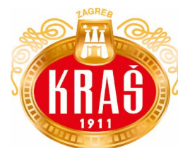
Logo Kraša 1

Kraš prehrambena industrija d.d. iz Zagreba svoju povijest započinje 1911. godine kao tvornica Union i to kao prvi industrijski proizvođač čokolade u jugoistočnoj Europi. Union ubrzo postaje carski i kraljevski dobavljač bečkog dvora, što je u ono vrijeme bila najbolja moguća referenca. U 1923. godini tvrtka Bizjak na Savskoj cesti u Zagrebu počinje s proizvodnjom vafli, keksa i dvopeka, te ubrzo postaje značajan faktor u regiji. Nakon Drugog svjetskog rata odnosno od 1950. godine tvornice Union i Bizjak te još neki manji proizvođači ujedinjuju se pod imenom Josipa Kraša koji je bio istaknuti antifašistički borac i rukovodilac sindikalnog pokreta. Josip Kraš nastavlja razvijati tri grupe konditorskih proizvoda: kakao proizvodi, keksi i vafli te bombonski proizvodi. Od 1992.