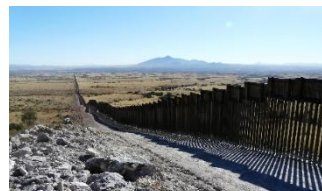
Slika projekta US-Mexico border walla 1

Ovo je projekt izgradnje zida na granici SAD-a i Mexica, a koji financira SAD uz potporu njenog samog predsjednika Donalda Trumpha. Namjena zida-granice bila bi sprječavanje ilegalnih prelazaka meksičkih građana, koji