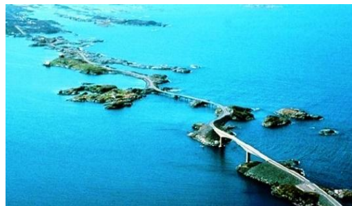
Slika projekta Coastal Highway Route 1

Ovo je projekt izgradnje autoceste E39 koji će dužinom od 1 100 kilometara spajati zapadnu obalu Norveške, sve do krajnjeg sjevera (Trondheim) pa do Christiansanda na jugu, odnosno do mosta koji Norvešku spaja s Danskom i zapadnom Europom.