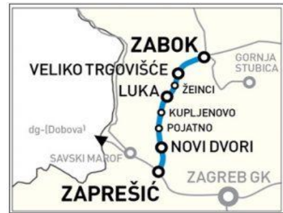
Slika projekta pruge Zaprešić-Zabok 1

Projekt modernizacije i elektrifikacije pruge Zprešić-Zabok u duljini od 23,85 kilometara regionlanog je karaktera, a realizira se na području Zagrebačke i Krapinsko-zagorske županije. Ima važnu ulogu u putničkom prijevozu, jer se tom relacijom mjesečno koristi 100 tisuća putnika. Cijeli projekt procijenjen je na 614,4 milijuna kuna, a s 85% sufinancira ga Europska unija putem operativnog programa konkurentnosti i kohezije. Radovi su započeli tijekom ljeta 2019. godine, a planirani završetak očekuje se do kraja 2021. godine.