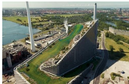
Slika projekta Copenhagen Inciniratora 1

Čudo od projekta, tako bismo mogli nazvati izgradnju najveće i najbolje spalionice smeća u Europi, čija je tendencija razvoja daleko ispred drugih.