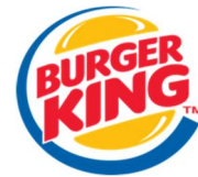
Logo Burger Kinga 1