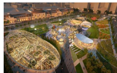
Slika projekta podzemnog trg. centra 1

Ovaj projekt bazira se na prirodnoj katastrofi koja se dogodila prije desetak godina. Tada se blizu samog centra Moskve uz Paveletsky željezničku stanicu stvorila ogromna jama koja se punila vodom nakon kišnih razdoblja i