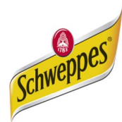
Logo Schweppesa 1

Schweppes je osvježavajuće gazirano piće koje se pojavljuje u nekoliko okusa. Piće je nastalo davne 1785. godine, a proces proizvodnje karbonizirane mineralne vode otkrio je Johann Jacob Schweppe i u Ženevi osnovao tvrtku. Današnji je većinski vlasnik američka kompanija Dr. Pepper. Slogan „Schhh-You Know Who“ nastao je sredinom 20. stoljeća.