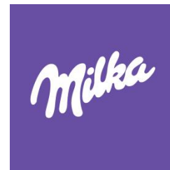
Logo Milke 1

Prvu čokoladu Milka napravio je švicarski slastičar Phillippe Suchard 1901. godine, dok je današnji vlasnik licence međunarodni koncern Kraft Foods. Ime Milka je složenica prvih nekoliko slova dviju riječi: MILch i KAKao.