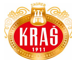
Logo Kraša 1

Kraš prehrambena industrija d.d. iz Zagreba svoju povijest započinje 1911. godine kao tvornica Union i to kao prvi industrijski proizvođač čokolade u jugoistočnoj Europi. Union ubrzo postaje carski i kraljevski dobavljač bečkog dvora, što je u ono vrijeme bila najbolja moguća referenca. U 1923. godini tvrtka Bizjak na Savskoj cesti u Zagrebu počinje s proizvodnjom vafli, keksa i dvopeka, te ubrzo postaje značajan faktor u regiji. Nakon Drugog svjetskog rata odnosno od 1950. godine tvornice Union i Bizjak te još neki manji proizvođači ujedinjuju se pod imenom Josipa Kraša koji je bio istaknuti antifašistički borac i rukovodilac sindikalnog pokreta. Josip Kraš nastavlja razvijati tri grupe konditorskih proizvoda: kakao proizvodi, keksi i vafli te bombonski proizvodi. Od 1992.