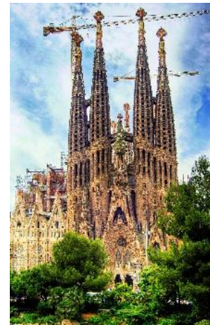
Slika projekta Sagrade Familiae 1

Prije svega, treba spomenuti čovjeka koji je dizajnirao i osmislio samu baziliku i ostavio gradu Barceloni projekt kao svoje nasljedstvo, a koje se pretvorilo u jednu od najimpresivnijih građevina današnjice, a još se uvijek gradi. Njegovo ime je Antoni Gaudi. Antoni se školovao u gradu Reus gdje je odmah pokazao talent za geometriju i arhitekturu i gdje će razviti neka od svojih spektakularnih djela. Gaudi je Sagradu Familiju počeo graditi na način da je eksperimentirao s nosivošću materijala da utvrdi koji će biti izdržljiviji, a to se pokazalo kao uspješna metoda koju su nastavili primjenjivati nakon njegove smrti. Neke od najvažnijih građevina koje je Gaudi konstruirao i izgradio osim Sagrade Familie nalaze se u Barceloni, kao na primjer: Park Güell, Casa Vicens, Casa Batlló, Casa Milà, Casa Calvet, Torre Bellesguard and Col·legi de les Teresianes. Osmislio je i mnogo drugih projekata, ali ove su građevine najvažnije.