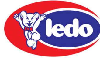
Logo Ledo 1

Povijest Ledo počinje proizvodnjom prvog industrijskog sladoleda na štapiću 1958. godine, popularne Snjeguljice, u sklopu Zagrebačke mljekare. Godine 1965. u pogon je puštena