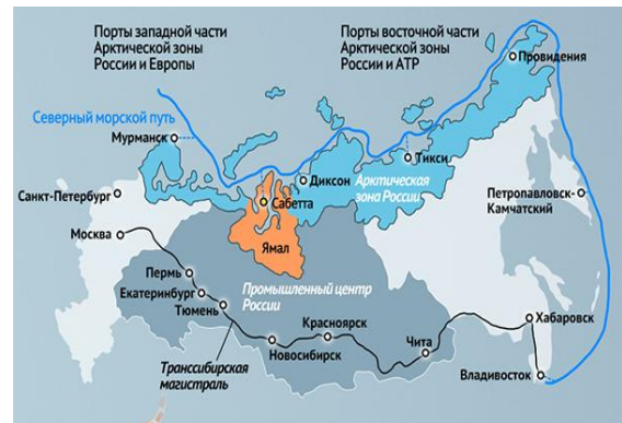
Slika projekta infrastrukture Rusije 1

Ovo će biti jedan iznimno veliki projekt jer je ruska vlada isplanirala remont željezničkih pruga, zračnih luka, pomorskih luka, autocesta i ostale infrastrukture diljem cijele zemlje. Vlada će osigurati 6,3 trilijuna rubalja (odnosno 96 bilijuna američkih dolara) za taj projekt koji bi trebao biti završen do kraja 2024. godine.