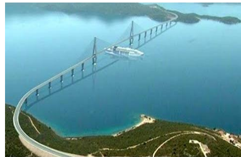
Slika projekta Pelješkoga mosta 1

Izgradnja Pelješkog mosta je od iznimne strateške i političke važnosti za našu zemlju. Most će nakon izgradnje uspostaviti čvrstu vezu Hrvatskog teritorija sa svojim najjužnijim dijelom, Dubrovačko-neretvanskom županijom, bez prelaska preko teritorija susjedne nam Bosne i Hercegovine. Most će spojiti kopno s poluotokom Pelješcem preko morskog tjesnaca u dužini