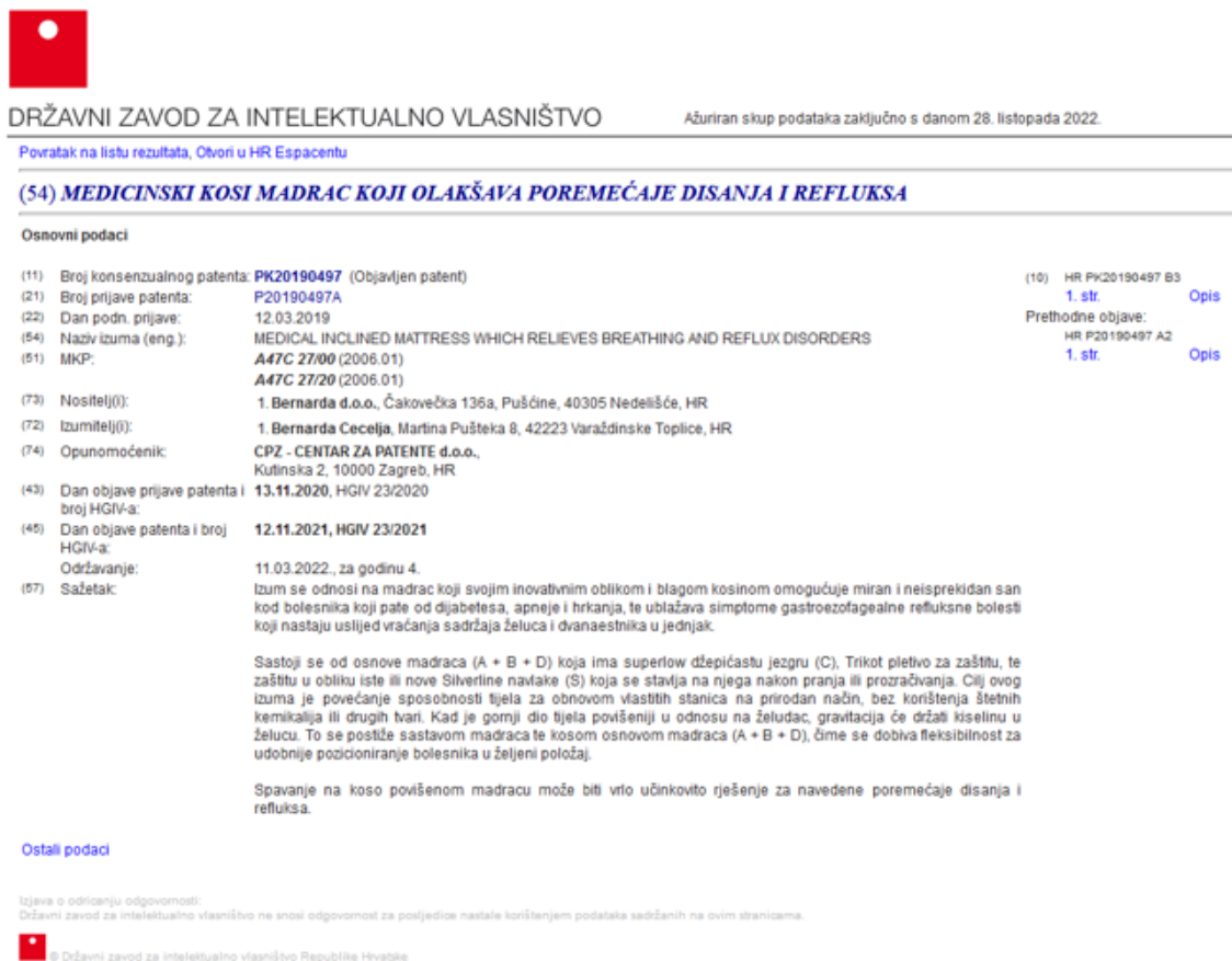
Slika 3. Primjer važećeg patenta 24

Primjer važećeg patenta vidljiv je na slici 3.