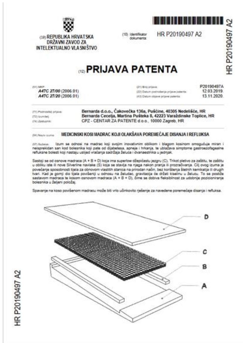
Slika 2. Primjer prijave patenta 19

Slikom 2. prikazan je izgled prijave patenta medicinskog kosog madraca koji olakšava poremećaje disanja i refluksa.