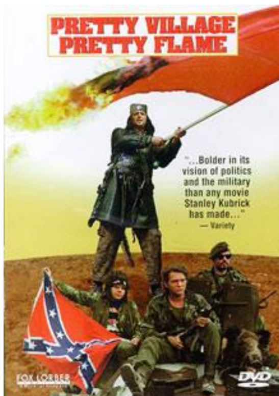
Slika 1 Poster filma "Lepa sela, lepo gore"

Suočavanje s ratnom stvarnošću: Film prikazuje strašne aspekte rata, uključujući nasilje, uništenje i patnju civila.