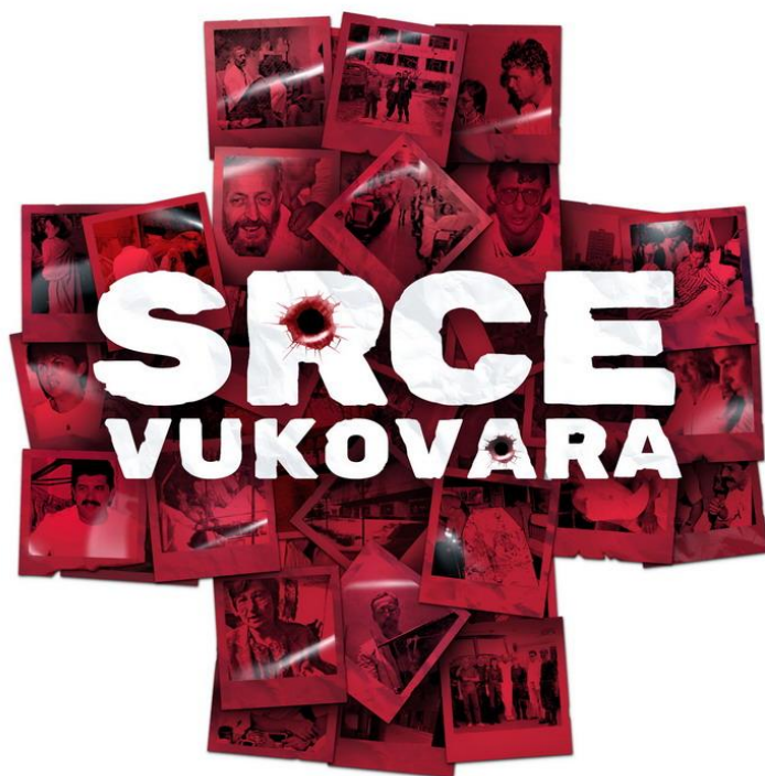
Slika 2 Dokumentarni film "Srce Vukovara"

Dokumentarac koristi mješavinu arhivskih snimaka, iskrenih intervjuja i pažljivo osmišljenih rekonstrukcija kako bi stvorio impresivno vizualno iskustvo. Paleta boja može suprotstaviti surovu stvarnost ratom razorenog Vukovara s bljeskovima živih sjećanja, bilježeći i brutalnost sukoba i neukrotivi ljudski duh. Rad kamere izmjenjuje se između intimnih krupnih planova koji bilježe emocije urezane na licima uključenih pojedinaca i širokih kadrova koji publiku stavljaju usred razaranja i otpornosti bolničkog okruženja.