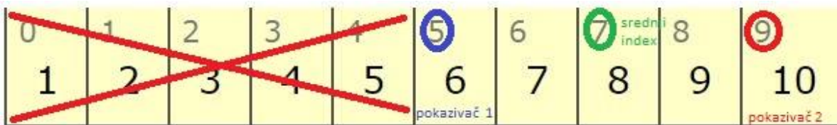
Slika 5. Binary pokazivači 2.korak

Zatim pomiče pokazivače na najmanju, najveću i srednju indeksnu vrijednost (kao što vidimo na slici 5) te ponovo uspoređuje vrijednost na kojoj se nalazi srednji indeks s traženom vrijednošću. U našem slučaju ponovno zanemaruje lijevu stranu liste jer tražena vrijednost je 9, a srednja je 8 tako da tražena vrijednost je veća od srednje, te zaključuje da se nalazi na desnoj strani od srednjeg indexa pa dobijemo sljedeće: