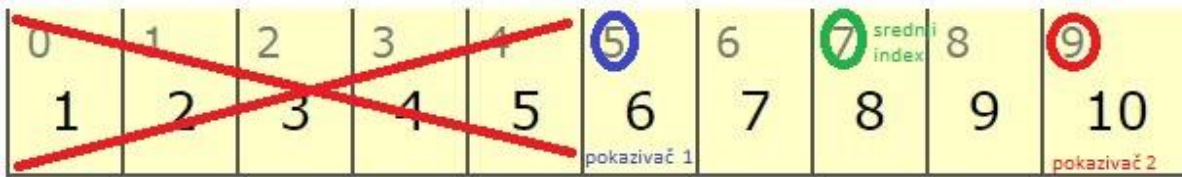
Slika 5. Binary pokazivači 2.korak

Zatim pomiče pokazivače na najmanju, najveću i srednju indeksnu vrijednost (kao što vidimo na slici 5) te ponovo uspoređuje vrijednost na kojoj se nalazi srednji indeks s traženom vrijednošću. U našem slučaju ponovno zanemaruje lijevu stranu liste jer tražena vrijednost je 9, a srednja je 8 tako da tražena vrijednost je veća od srednje, te zaključuje da se nalazi na desnoj strani od srednjeg indexa pa dobijemo slijedeće: