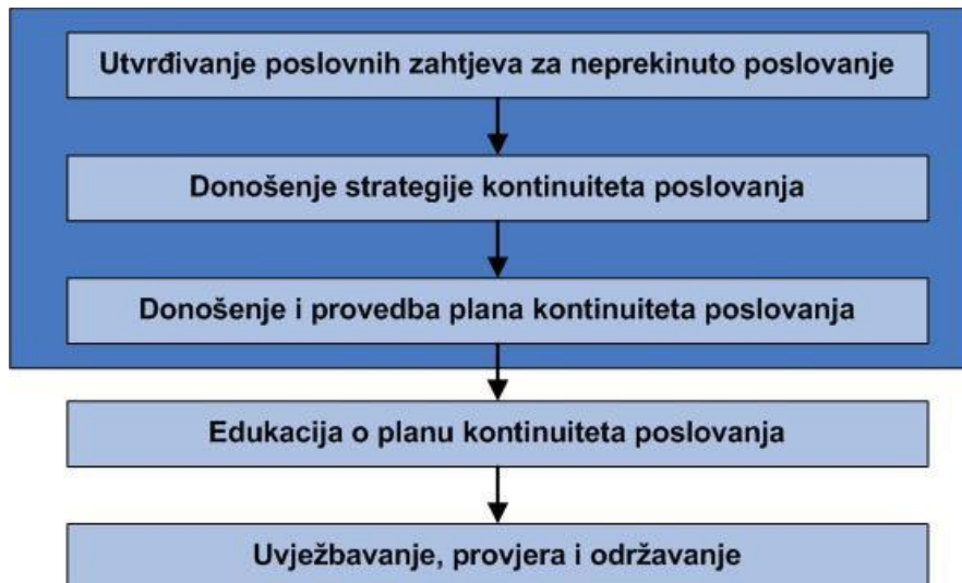
Slika 3.: Faze izrade plana kontinuiteta poslovanja (uradak autora)

Osnovne faze izrade plana kontinuiteta poslovanja (slika 3.) obuhvaćaju pripremne aktivnosti i određivanje poslovnih zahtjeva koji se moraju osigurati očuvanjem kontinuiteta poslovanja. Započinje se analizom, odnosno izradom Politike kontinuiteta poslovanja na razini organizacije, a zatim slijedi ocjena rizika te analiza utjecaja neželjenih događaja na poslovne procese kao temelj za sve elemente plana koji se izrađuje u kasnijim etapama.