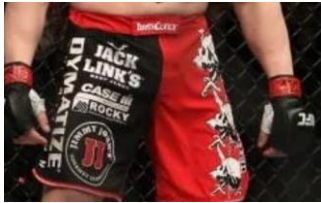
slika 1. UFC sponzorstva na borcima

https://www.essentiallysports.com/ufc-news-there-was-really-no-money-left-daniel-cormier-opens-up-on-reebok-contract/