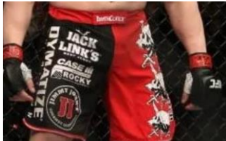
slika 1. UFC sponzorstva na borcima

https://www.essentiallysports.com/ufc-news-there-was-really-no-money-left-daniel-cormier-opens-up-on-reebok-contract/