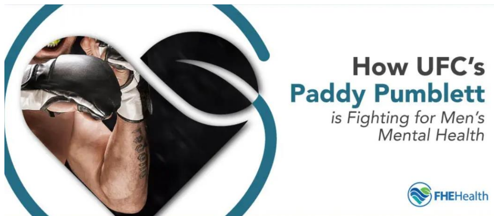
slika 1. UFC borba za mentalno zdravlje muškaraca

https://fherehab.com/learning/paddy-pimblett-mental-health