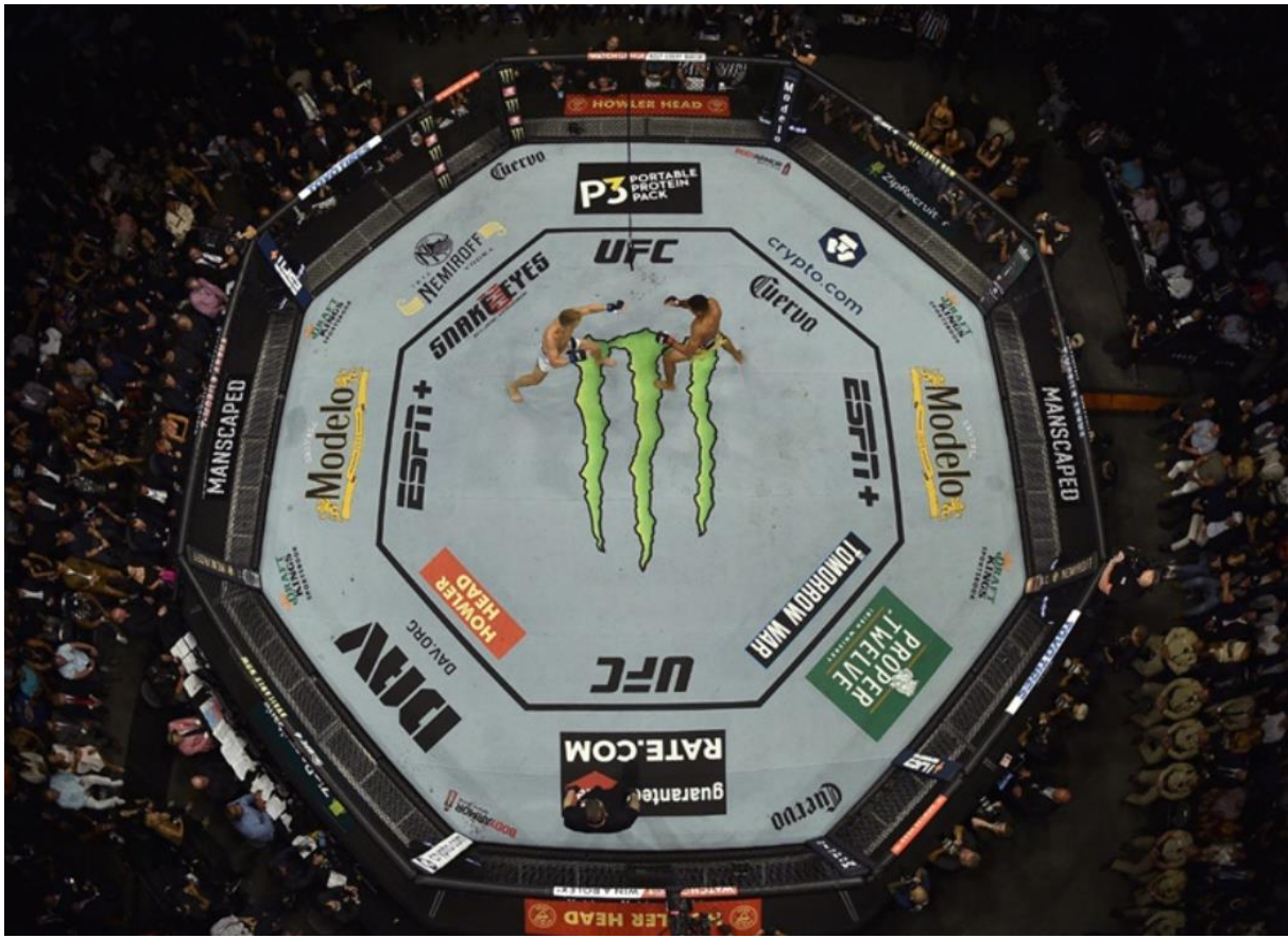
slika 1. UFC sponzori

https://www.sportsbusinessjournal.com/Daily/Issues/2021/08/12/Marketing-and-Sponsorship/UFC-Monster.aspx