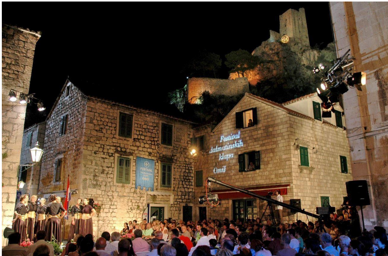
Slika 3. Prikaz Festivala dalmatinskih klapa u Omišu

i neformalne pjevačke družine koje preuzimaju termin klapa. Danas riječ klapa najčešće asocira na organizirane pjevačke skupine sa specifičnim a capella repertoarom dalmatinskih klapskih pjesama. Pojam festivalska klapa povezan je s nastankom Festivala dalmatinskih klapa u Omišu (Omiški festival). Omiški je festival uvelike zaslužan za promociju klapskog pjevanja i prva je institucija koja je klapsko pjevanje prezentirala kao organizirani oblik tradicijskog (a kasnije i umjetničkog) glazbovanja. Festival klapa je formalno organizirana skupina pjevača s jasnim ciljevima i namjerama. Postanak Omiškog festivala kao institucije inicirao je nastanak mnogih klapa. 10