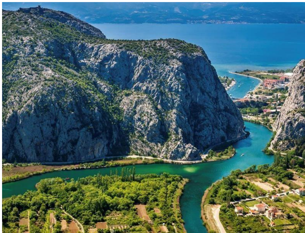
Slika 4. Kanjon Cetine

proboja rijeke u more, poprimio ogromne dimenzije gledajući iz perspektive grada Omiša. Sagledavajući cjelokupni prostor kanjona Cetine vidimo da je to vrlo prostrano područje Dalmatinske zagore i priobalja, velikim dijelom prirodno i nenarušeno, ali na pojedinim dijelovima kultivirano u blizini pojedinih sela. Ovo područje ima svoj odgojno- obrazovni potencijal zbog mogućnosti prezentacije geoloških i prirodoslovnih fenomena. Također ovaj prostor ima svoje mnogobrojne kulturno- povijesne značajke (Tvrđava Starigrad- poznata Omiška fortica, crkvice Sv. Rok i Sv. Duh, tvrđava Peovica/ Mirabella /, ruševine starog Oneuma- Omiša itd.) Turističko- rekreacijske vrijednosti i mogućnosti ovog područja su izuzetno velike. Nabrojiti ćemo samo neke od njih: rafting, plovljenje kanuima, poznata izletišta-Radmanove mlinice i Kaštel Slanica (ugostiteljske aktivnosti u blizini rijeke i u kanjonu te ponuda ribljih i riječnih specijaliteta (pastrve, jegulje, riječni rakovi), planinarenje, sportsko penjanje, teniska igrališta, pješačke staze, planinski biciklizam, izlet na vrlo lijepe vodopade Velika Gubavica i Mala Gubavica itd. (Pešić,2006:18)