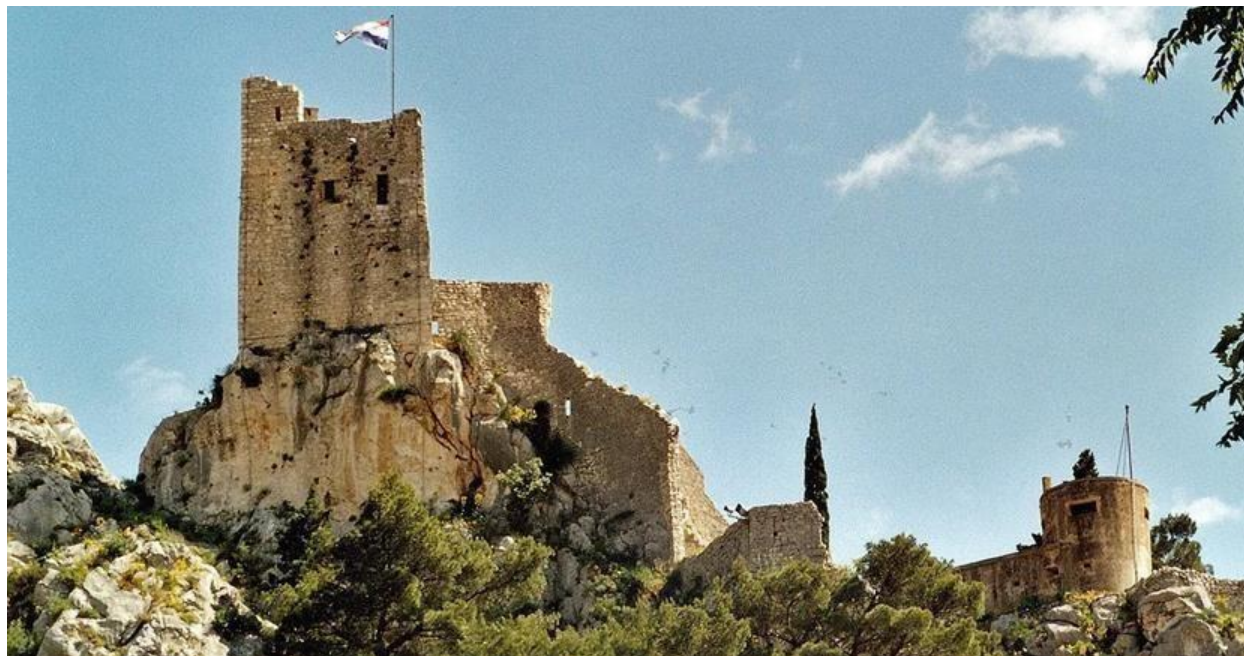
Slika 5. Tvrđava Peovica/ Mirabela