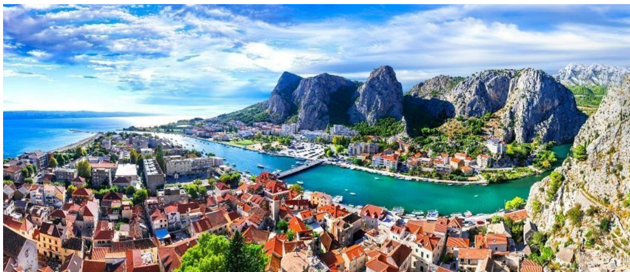
Slika 1. Grad Omiš

Kada govorimo o gradu Omišu danas, tada možemo reći da administrativno ulazi u sastav Splitsko-dalmatinske županije te se smatra središtem jugoistočnog dijela splitske aglomeracije. Prema popisu stanovništva iz 2011., ima 14.936 stanovnika u 31 naselju. I stanovništvo i turistička aktivnosti koncentrirani su u sedam obalnih naselja – Omišu, Stanićima, Čelini, Lokvi Rogoznici, Mimicama, Marušićima i Pisku – u kojima živi dvije trećine stanovnika i u kojima se odvija preko 90 posto turističkog prometa. Najveće je naselje je Omiš sa 6.462 stanovnika, odnosno 43,4% ukupnog stanovništva. (Boranić Živoder et al.,2020)