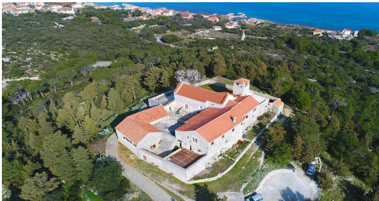
Slika 9. Benediktinski samostan na brdu Čokovac

Benediktinski samostan na brdu Čokovac 10 ponad mjesta Tkon na otoku Pašmanu, centralno je mjesto obnove i zaštite pisma glagoljice iako je prije svega sakralni objekt, samostan je glavna turistička atrakcija na otoku Pašmanu.