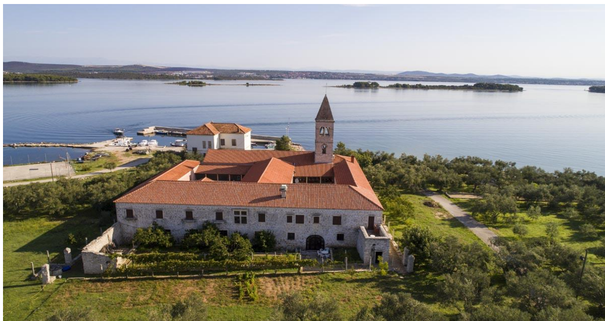
Slika 10. Franjevački samostan Sv. Dujma u Kraju

Samostan i crkvu sagradila je patricijska obitelj na mjestu koje su franjevcima poklonili benediktinci s Čokovca. Gradnja samostana je, vjerojatno, započela 1394. godine, a u funkciji je u drugoj polovici 15. stoljeća. Samostan je kasnije pregradnjama obnovljen u baroknom stilu tijekom 17. stoljeća, otkud potječu i dvorišna vrata samostana. Posebno su vrijedni samostanski klaustar, slike Bogorodice s malim Isusom iz 15. st. i Posljednja večera u samostanskoj blagovaonici.