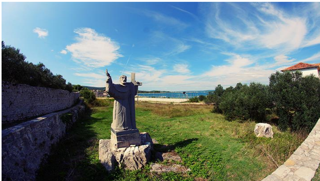
Slika 11. Kip svetog Frane ispred samostana

Franjevački samostan Sv. Dujma s crkvom je zaštićeni spomenik hrvatske kulture. Ima petnaest soba, a u svom okolnom prostoru ima vrt i maslinik od 150 stabala maslina. U sadašnjoj riznici nekad je bila biblioteka koja je s bogatim sadržajem i knjigama sada na katu samostana. U održavanju i obradi vrta i maslinika pomažu domaći ljudi sa otoka, dođu i ljudi iz Zadra, molitvene grupe iz samostana Sv. Frane. Franjevci plodove iz Kraja daju u zadarski samostan Sv. Frane. Poljodjelstvo i život s prirodom spada u franjevački život.