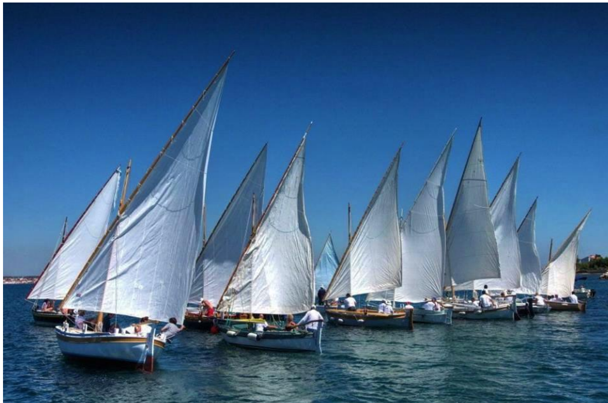
Slika 12. Regata „Đir po konalu“

Svaku godinu u Ugriniću i Tkonu na otoku Pašmanu u mjesecu srpnju održava se regata pod nazivom „ĐIR PO KONALU“ koja okuplja 100 – naj drvenih leuta, gajeta i kajića na oštra/latinska idra i trevu,