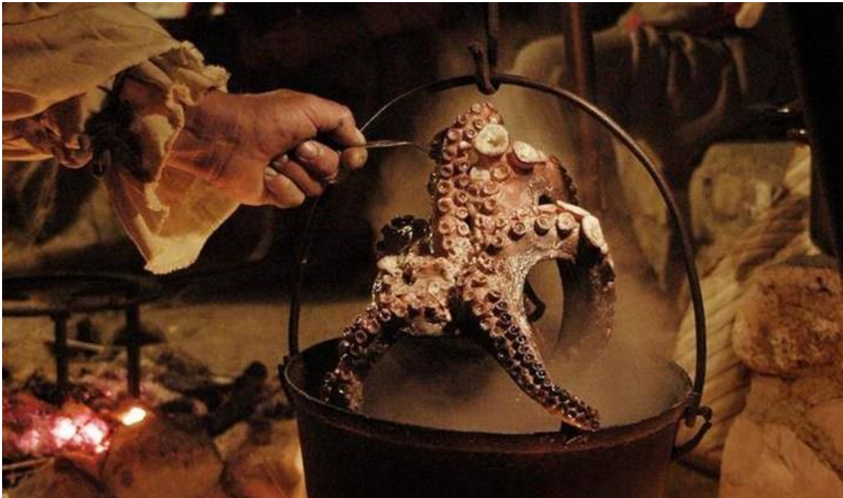
Slika 5. Rabska Fjera - priprema hrane na tradicionalna način

Izuzetna je to tradicija za jednu primorsku destinaciju, koja se najčešće smješta u ladicu s destinacijama u kojima su sunce i more prioriteti, a masovni turizam normalan slijed događanja. Srećom, povijest ostaje zapisana zauvijek, pa je tako i Rabskoj Fjeri omogućeno mjesto pod suncem u turističkoj ponudi Hrvatskih otoka.