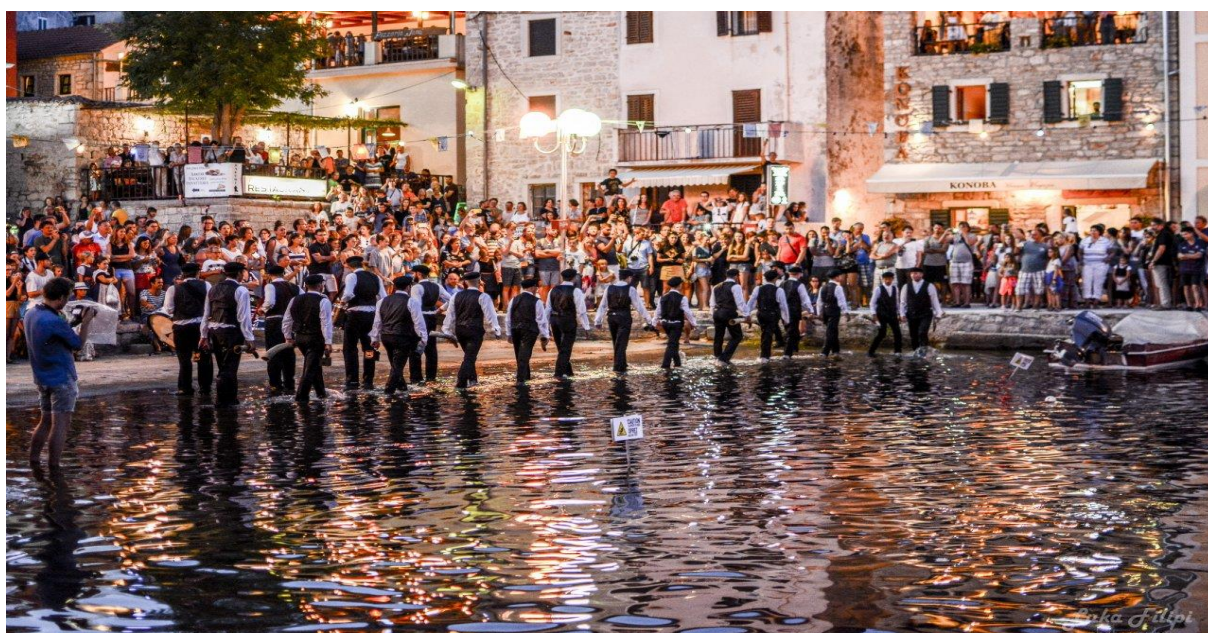
Slika 7. Fešta „Saljske Užance“

Obožavan čuti bubanj Tovareće mužike koji se popunjava potmulim zvukom volujskih rogova. Obožavam vidjeti onu djecu kako ih prate. Male curice i dječake u svojim fuštanićima i škarpinićima kakve se nosile njihove none. Kako mužika prolazi kroz selo ljudi se okupljaju u grozdovima. Uz nju se šuti. Ta šutnja je onaj saljski san. Slušati nju znači buditi divlje, iskonske Sali, koje buknu u šutnji slušača i rukanju mužike. Kako zmaj prolazi kroz mnoštvo, on plete zajedničku nit i sve nas povezuje. Kad Tovareća prolazi pored knjižnice ja zatvaram oči i snujem one lijepe Sali, onaj divan san koji zapravo kaže - , o kako bi lijepo bilo izaći iz indiferentnosti! 8 .