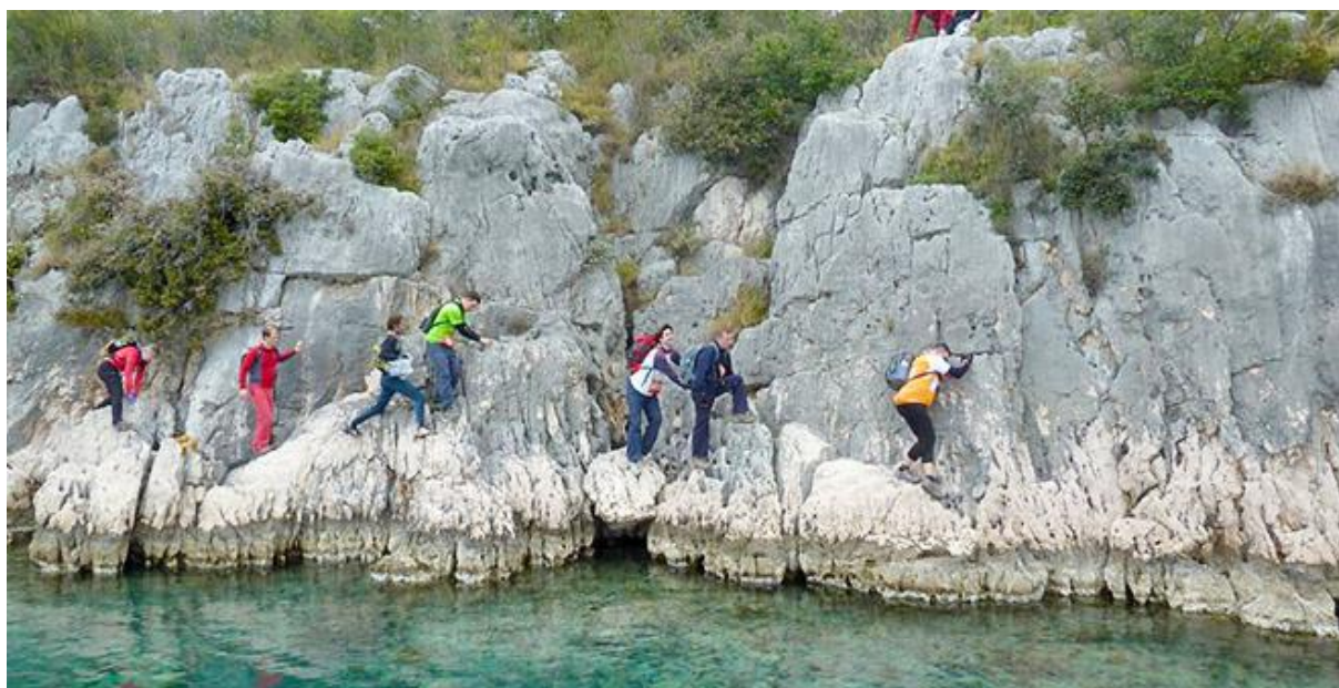
Slika 8. Škraping 2017.

Kad su organizatori prve trekning utrke „Škraping 9 “ 2006. godine planirali multi sport utrku, koja bi osim sportskog dijela uključivala i očuvanje lokalnih običaja i razvoj lokalne zajednice, nisu ni u najboljim planovima mogli zamisliti da će se ova utrka pretvoriti u najznačajniji događaj na otoku Pašmanu.