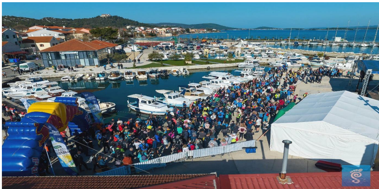
Slika 8. Škraping 2023.

Projekt „Škraping“ je ogledni primjerak kako dobro osmišljena turistička manifestacija može biti generator razvoja turizma na otocima, a istovremeno najvažniji element kod očuvanja i promocije lokalne tradicije i običaja.