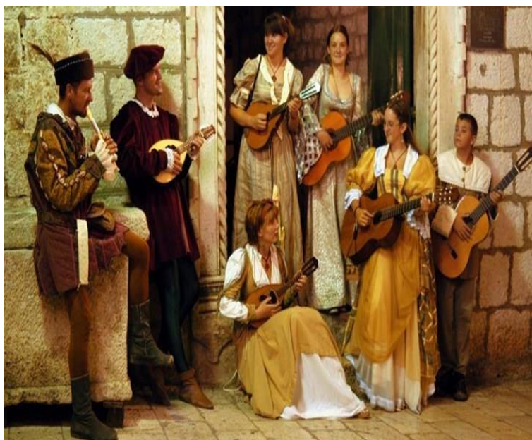
Slika 4. Rabska Fjera

Prvi i najveći srednjovjekovni festival u Hrvatskoj, Rabska Fjera, temelji se na tradiciji započetoj 21. srpnja 1364. godine kada je rapsko gradsko vijeće odlučilo odati počast kralju Ljudevitu Velikom 6 koji je Rab oslobodio mletačke vlasti. Taj se dan posvećuje i sv. Kristoforu, svecu zaštitniku grada Raba. Fjera je u prošlosti trajala 14 dana, kada je stanovništvo otoka slavilo moći sveca kojemu se prepisuje zasluga za spašavanje grada od uništenja.