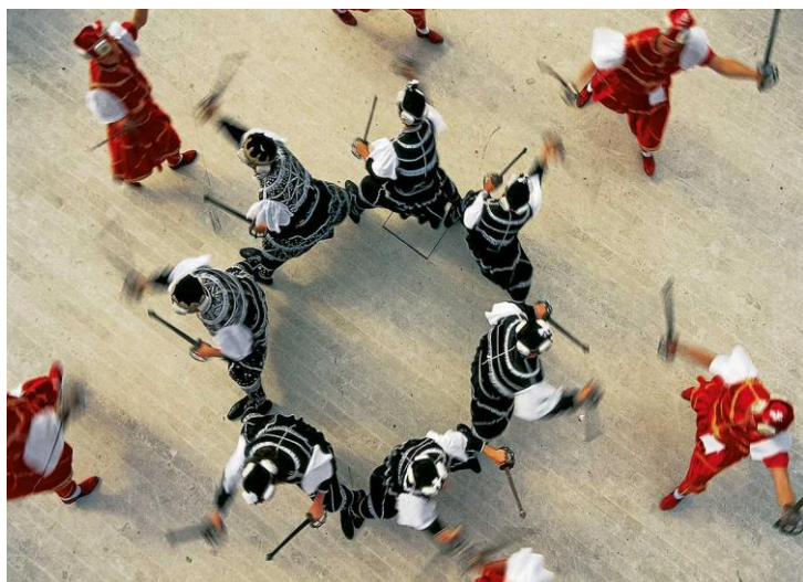
Slika 2. Kostimirani nastup

Moreška je vjerojatno došla u Korčulu preko Dubrovnika iz Španjolske, jer su u 15. stoljeću postojale jake veze između Dubrovačke Republike i Španjolske. Da su Dubrovčani poznavali morešku svjedoče djela poznatih dubrovačkih pisaca Marina Držića i Điva Palmotića. Dok je za Europu bila „modni hit“ Korčulane je toliko zaokupila da je u stoljećima koja slijede, postala nerazdvojni dio njihova življenja i običaja.