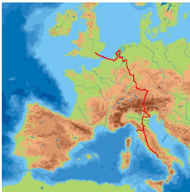
Slika 1. Crvena linija prikazuje uobičajeni „Grand Tour“ (Izvor: wikipedia.org)

Moderan turizam može se povezati sa nekadašnjim pojmom „Grand Tour“ 1 što je predstavljalo put u Europu (osobito Njemačku i Italiju) koji su organizirali pripadnici bogate Europske elite (poglavito iz zapadne i sjeverne Europe), a posebice njihova djeca koja su imala sredstva. Ovaj običaj je bio vrlo popularan od 1660 - tih sve do ekspanzije željezničke mreže sredinom 1840 – tih, te se povezivao sa ustaljenim rasporedom. Tradicija se uskoro širi na sve veći krug srednjeg sloja građanstva, prvenstveno sa razvojem željeznice. U 18. i