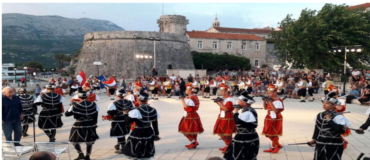
Sika 3. Kostiminirani nastup

S toga je moreška za Korčulane više od same mačevalačke igre, ona je dio života, o njoj se priča u svakoj korčulanskoj obitelji. Moreška kao tradicionalni običaj, danas je najprepoznatljiviji motiv Korčule i odličan primjer kako tradicija može biti glavni nositelj turizma.