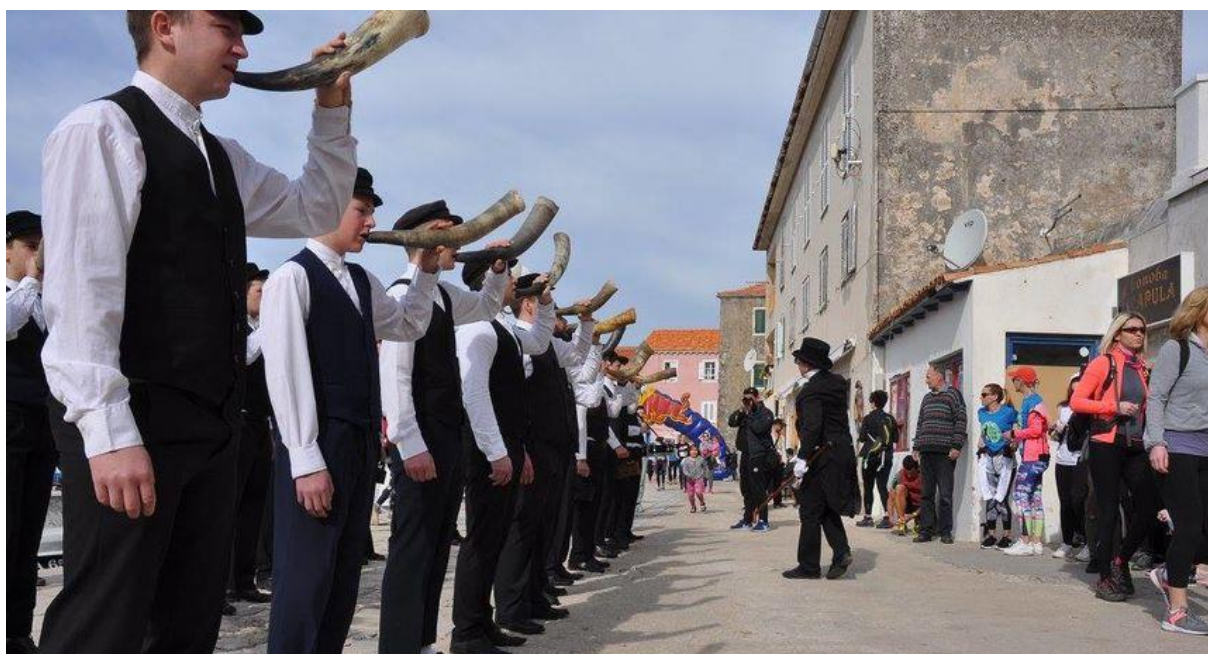
Slika 6. Tovareća Mužika na „Saljskim Užancama“

Kako mjesto Sali ima stoljetnu ribarsku tradiciju, svaka je kuća u prošlosti imala rog, koji je služio za davanje signala pri lovu na plavu ribu. Međutim mlađi naraštaj dosjetio se još jednog načina na koji se može upotrijebiti ovaj predmet: kao glazbeni instrument. Sve je počelo kao šala na račun onih koji se vjenčaju u poznim godinama. Godine 1960. jedna se stara cura udala za udovca u Zaglav. Vjenčanje su namjeravali održati potajno, ali je mladost doznala i organizirala šalu. Išli su za svatovima pušuci u rogove, udarajući u metalne dijelove alatki i u željezne pegle. Da bi ih se riješili, ženik i udavača su ih počastili pićem, a šaljivdije su po povratku u selo ponovno upriličili takve „koncerte“ sebi za gušt. Tako je nastala Tovareća mužika, koja danas djeluje kao udruga i svojim nastupom veliča mnoga događanja po Zadarskoj županiji, a i diljem Hrvatske 7 .