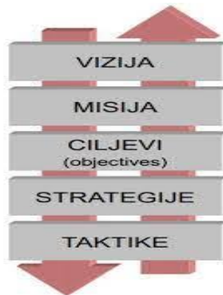
Slika 1. Elementi VMOST analize