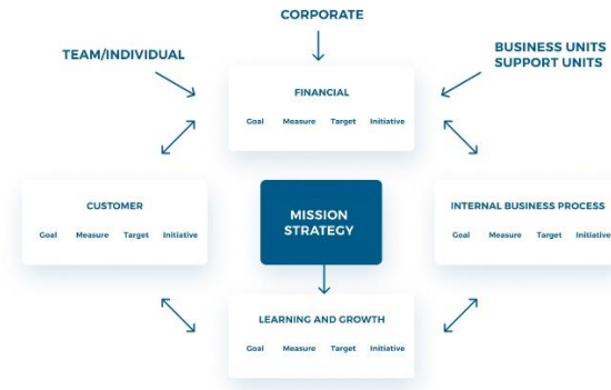
Slika 3. Elementi poslovne strategije