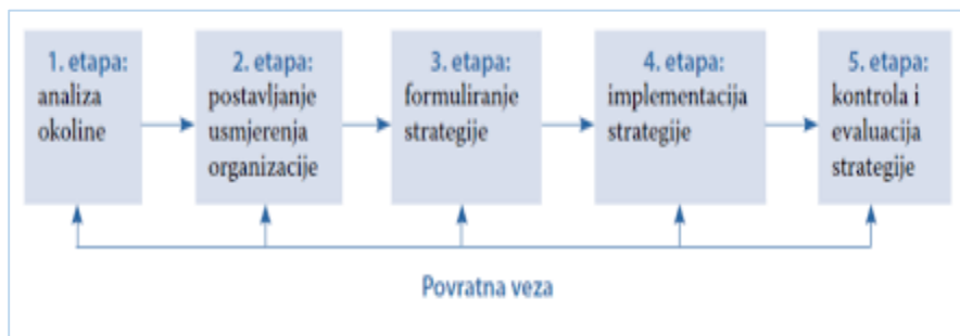
Slika 2. Strateška analiza po etapama

strateškog upravljanja je stjecanje održivo-strateške konkurentnosti organizacije. To je moguće razvijanjem i primjenom takvih strategija koje stvaraju vrijednost za organizaciju. Fokusira se na procjenu prilika i prijetnji, imajući na umu snage i slabosti organizacije i razvijanje strategija za njezin opstanak, rast i širenje.