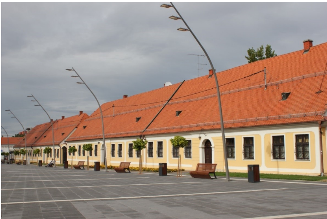
Slika 5. Kanoničke kurije

Ostale Kanoničke kurije – Smještaj ostalih 4 Kanoničke kurije je uzduž glavnog Đakovačkog trga u parovima spojene u nizu, formiraju zapadno pročelje trga. Gradnja kurija potaknuta je od strane carice Marije Terezije 1773. godine, sve zgrade su oblikovane isto. Sljedeća slika prikazuje građevine. (Slika 5.)