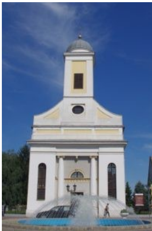
Slika 4. Crkva Svih Svetih

postaje đakovačkom župnom crkvom. 18 Slika u nastavku prikazuje Crkvu Svih Svetih s bočne strane (Slika 4.)