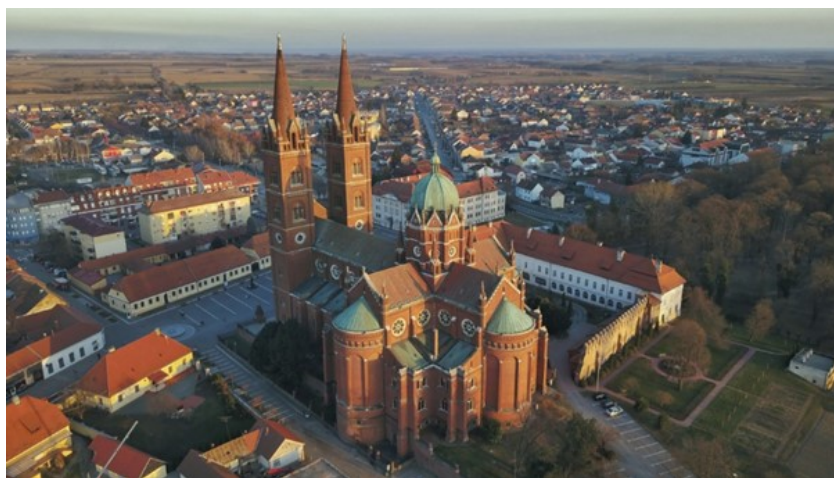
Slika 6. Katedrala sv. Petra Đakovo

Katedrala sv. Petra – gradnja katedrale trajala je od 1866. do 1882. godine. Nacrt za katedralu naručio je biskup Strossmayer u Beču kod arhitekta Karla Rösnera, ali u međuvremenu Rösnera umire te projekt preuzima arhitekt Friedrich Schmidt, koji je prema mišljenju mnogih mislioca najčuveniji gotičar 19. st. Sljedeća slika prikazuje pogleda na Katedralu iz zraka. (slika 6.)