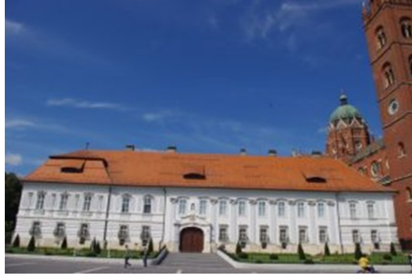
Slika 3. Biskupski dvor

Biskupski dvor lociran je na zapadnoj strani glavnog đakovačkog trga, trga Josipa Juraja Strossmayera. Građevina je nastala u 18. stoljeću, građena baroknim stilom u etapama. Biskupski dvor je jednokatna dvokrilna građevina. Krila, odnosno strane građevine nisu simetrične što je posljedica nadograđivanja. Na sljedećoj slici prikazano je pročelje Biskupskog dvora. (Slika 3.)