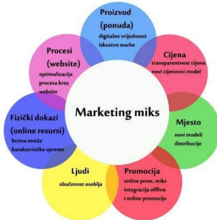
Slika 1. Sastavnice marketinga