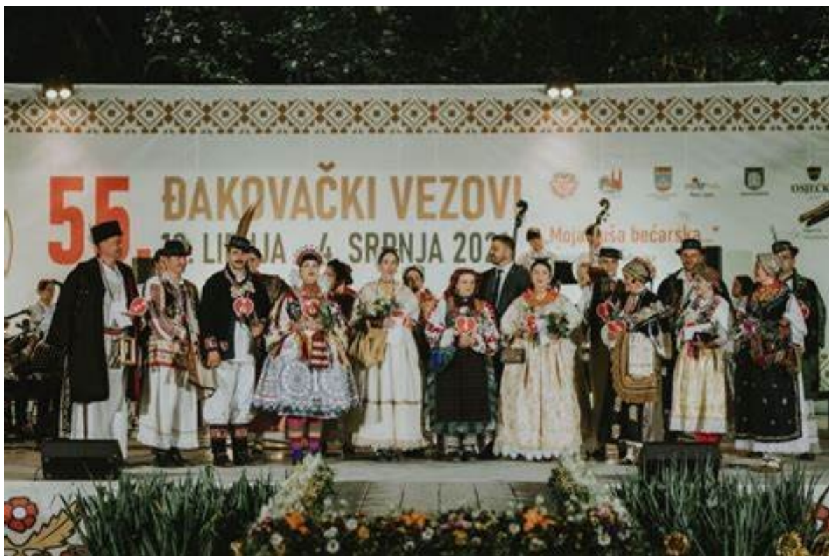
Slika 8. Đakovački vezovi

Da bi se dokumentirala i prenijela bogata povijest ovih događanja, godine 1970. počela je izlaziti "Revija Đakovačkih vezova." Slika broj 8 prikazuje pozornicu Đakovačkih vezova tijekom proslave njihove 55. obljetnice. 33