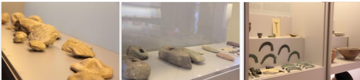
Slika 7. Dio arheološke zbirke muzeja Đakovština

Muzej Đakovštine „Muzej Đakovštine je smješten u zgradi bivšeg kotara, izgrađenoj potkraj 19. st., u današnjoj ulici Ante Starčevića u Đakovu.“ 24 Arheološka zbirka muzeja obuhvaća predmete od mlađeg kamenog doba do razvijenog srednjeg vijeka, predmeti dokazuju kontinuitet nastanjivanja prostora Đakova i bliže okolice kroz period od 5000 godina prije Krista. Arheološka zbirka nastala je donacijama i pohranjivanjem inventara mnogih arheoloških nalazišta tog prostora. 25 Sljedeća slika prikazuje dio arheološke zbirke muzeja (slika 7.)