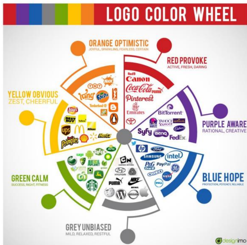
Slika 1 Boje logotipa

Izvor; Kovačević, D., Mešić, E., Užarević, J., & Brozović, M. (2022). The influence of packaging visual design on consumer food product choices. Journal of Print and Media Technology Research , 11(1), 7–18.