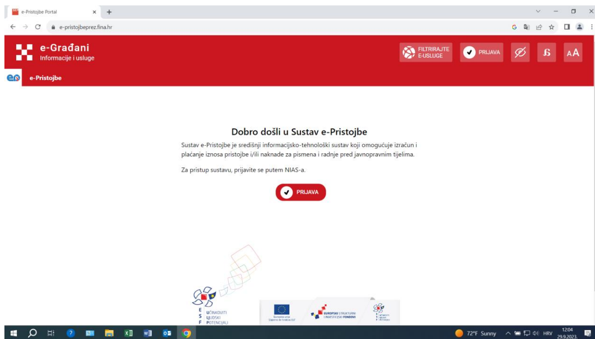
Slika 2. Sustav e-Pristojbe

Na slici 2. je prikazan početni zaslon aplikacije e-Pristojbe.