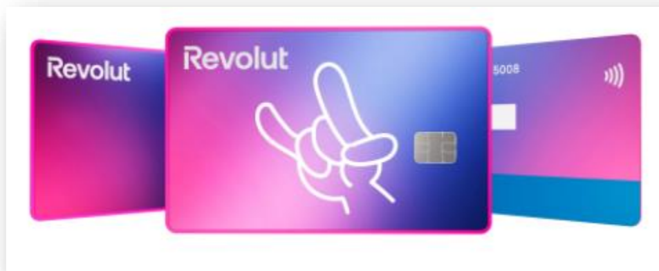
Slika 6. – Prikaz Plus Revolut kartice