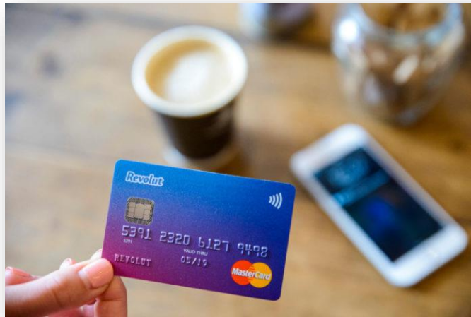
Slika 4. – Prikaz Revolut kartice

Jedna od zanimljivih usluga koje pruža Revolut kartica je i plaćanje troškova po odličnim tečajevima. Na primjer, pri biranju dizajna kartice, korisnik može i birati boju, oblik, veličinu i sliku/skicu kartice. Revolut ima više od 330. 000 korisnika u RH.