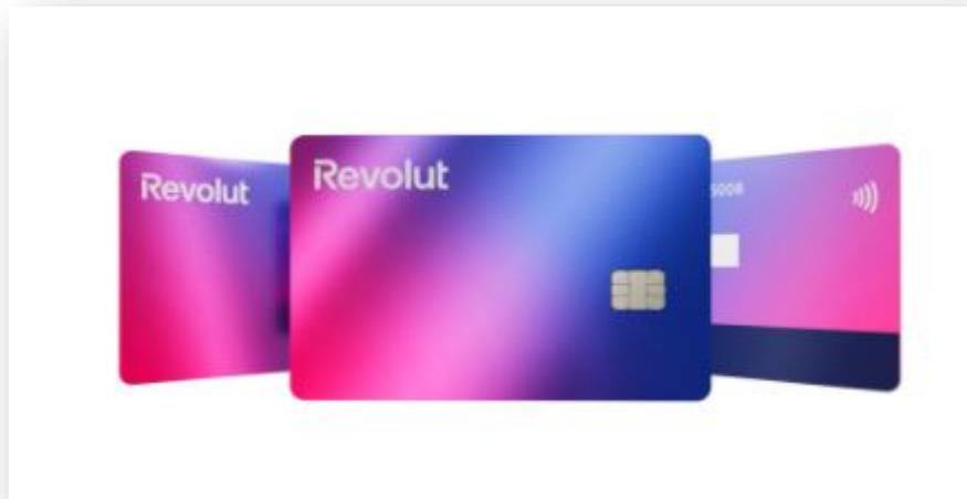
Slika 5. – Prikaz standardne Revolut kartice