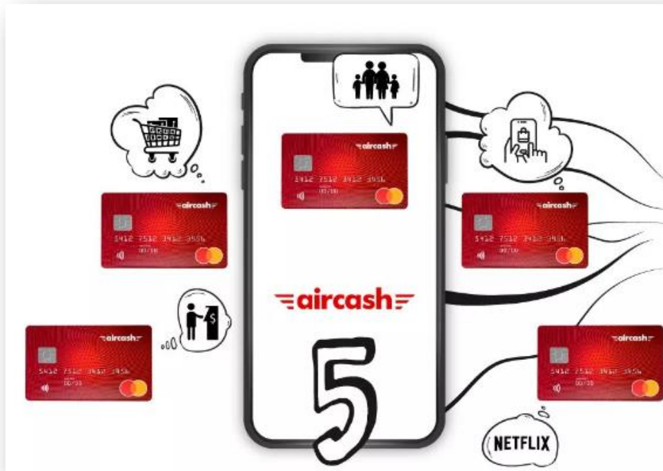
Slika 3. – Prikaz Aircash Mastercard kartice i aplikacije