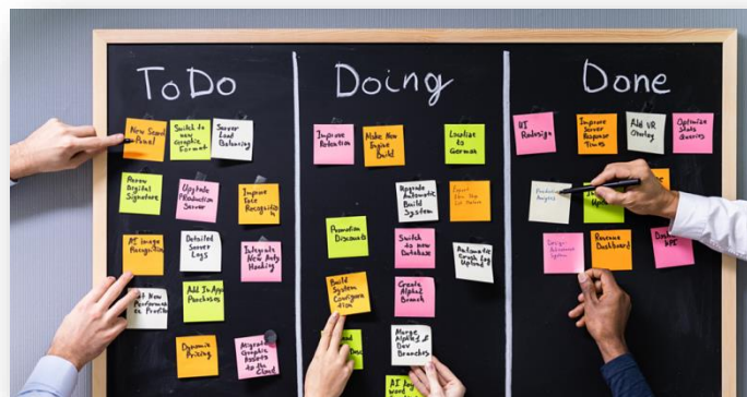
Slika 1. – Prikaz Kanban ploče

Natpisi označavaju zadatke poput napraviti (eng. To do), u procesu (Doing) i dovršeni zadaci (eng. Done).