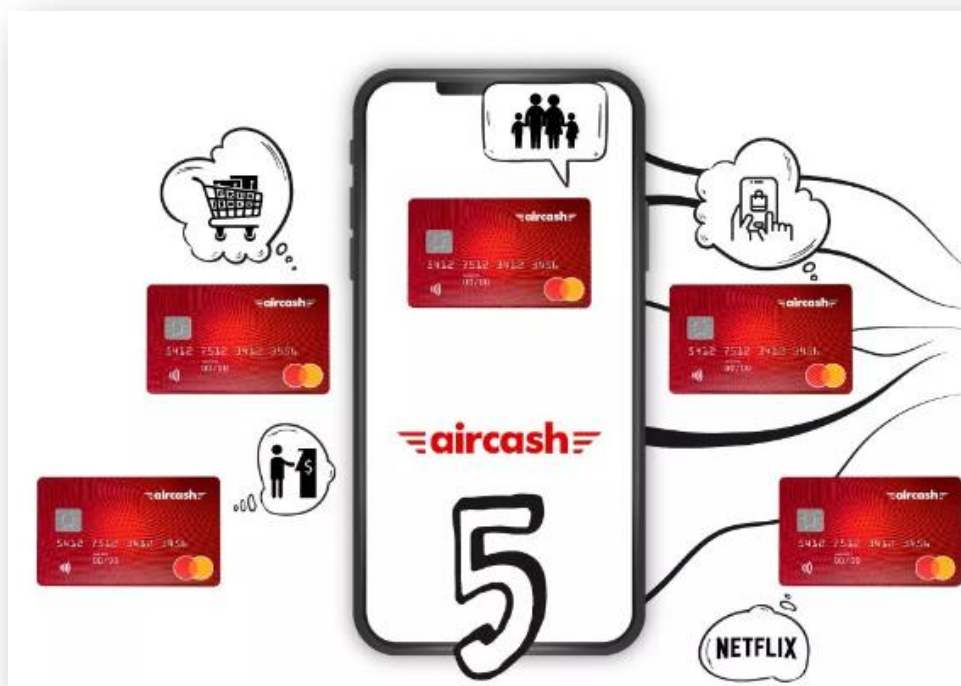
Slika 3. – Prikaz Aircash Mastercard kartice i aplikacije