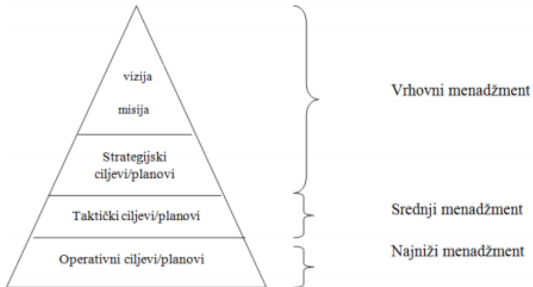
Slika 2. Razine planiranja