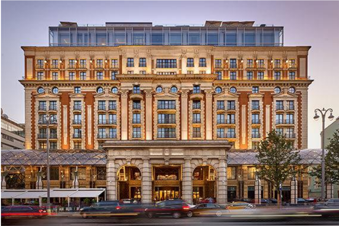
Slika 5 The Ritz-Carlton, Moskva, Rusija