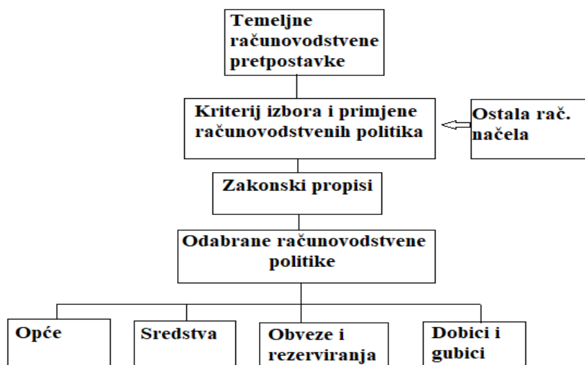
Slika 1. Postupak odabira računovodstvenih politika

Transparentnost u objavljivanju i objašnjenju odabranih računovodstvenih politika, kao i bilo kakvih promjena u tim politikama, omogućuje korisnicima financijskih izvještaja da razumiju kako su financijske informacije pripremljene i koje procjene ili pretpostavke su korištene. Na kraju, prilagodljivost je važna kako bi se osiguralo da računovodstvene politike mogu adekvatno odgovoriti na promjene u poslovnom okruženju, operacijama poduzeća ili regulativnim zahtjevima. To znači da poduzeća moraju redovito revidirati i ažurirati svoje računovodstvene politike kako bi osigurala da one i dalje odražavaju stvarno stanje i potrebe poduzeća (Žager, K., Žager, L., 2008). Postupak odabira računovodstvenih politika predstavljen je na sljedećem grafičkom prikazu.