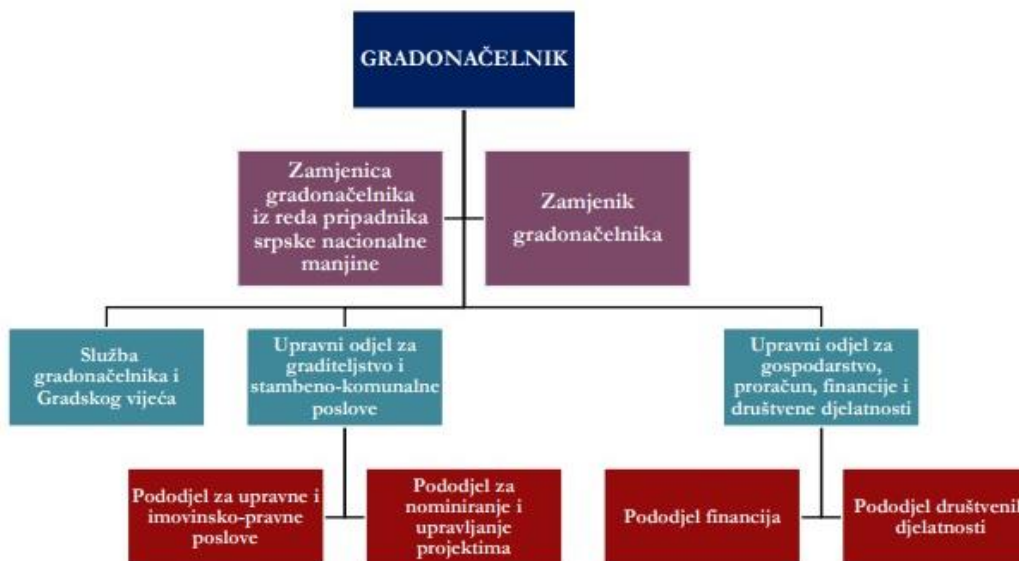
Slika 2. Organizacijska struktura gradske uprave Grada Belog Manastira