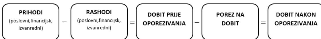
Slika 2. Skraćeni prikaz računa dobiti i gubitka

uspješnost poslovanja ovisi o postavljenim kriterijima i definiranim ciljevima. Najčešći cilj koji se ističe je profitabilnost poslovanja. Za razliku od bilance koja prikazuje financijski položaj poduzeća u određenom vremenskom razdoblju, račun dobiti i gubitka prikazuje aktivnost poduzeća u određenom razdoblju. 7 Osnovni elementi tog izvještaja jesu prihodi i rashodi i njihova razlika dobiti ili gubitak. Prema tome, račun dobiti i gubitka je financijski izvještaj koji prikazuje koliko je prihoda i rashoda ostvareno u određenom vremenu te kolika je ostvarena dobit (gubitak).