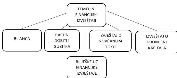
Slika 1. Temeljni financijski izvještaji