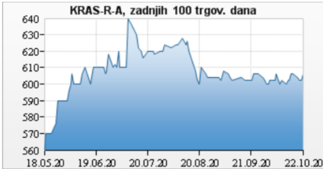
Slika 5. Kretanje cijena dionica u zadnjih 100 dana