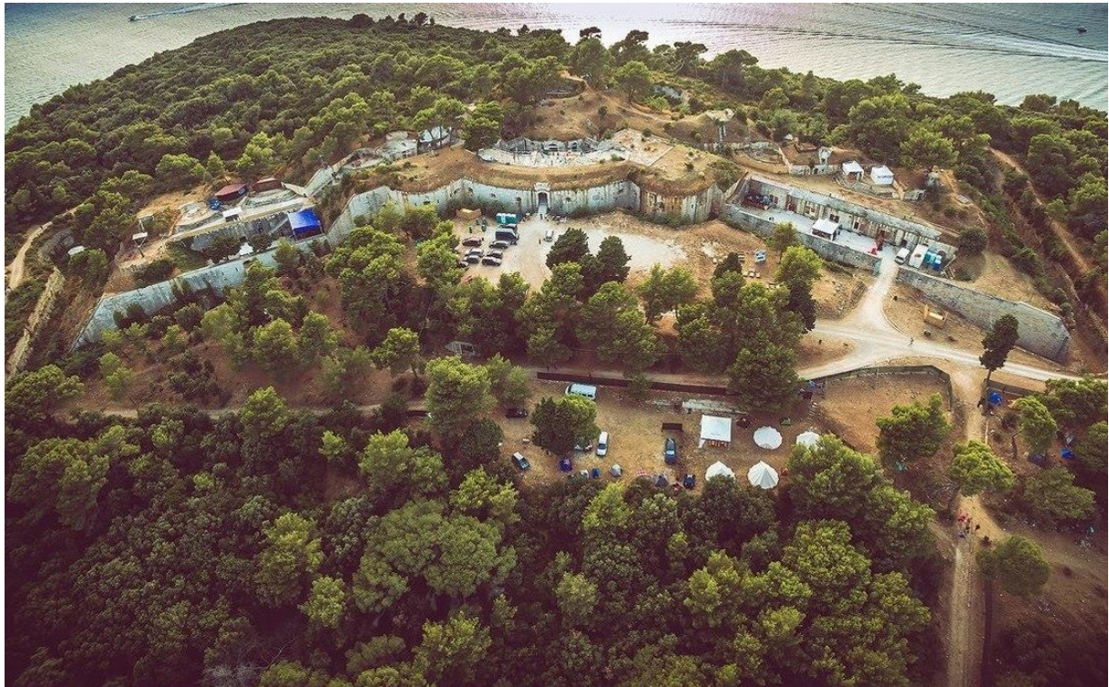
Slika 2 Tvrđava Punta Christo (Daniel Kiršić, 2017)

Izvor: http://seasplash-festival.com/hr/festival/15th-seasplash-2017/objavljeni-datumi-15-seasplash-festivala-prodaji-prve-ulaznice/