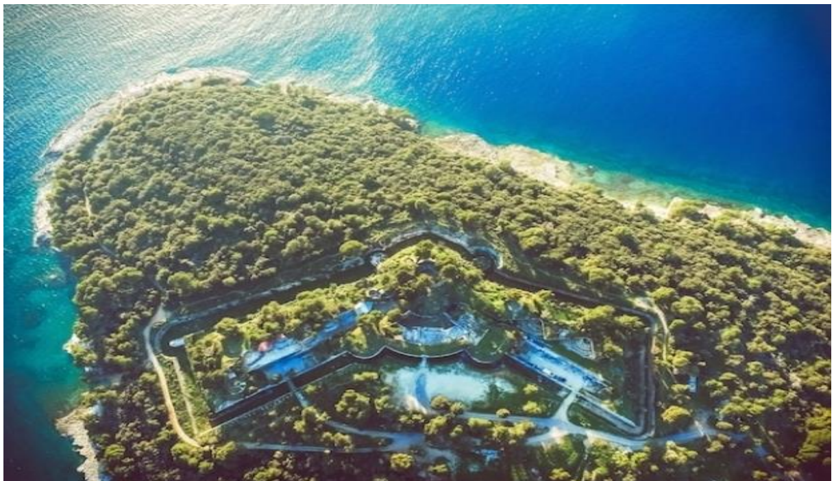
Slika 3 Tvrđava Punta Christo iz zraka