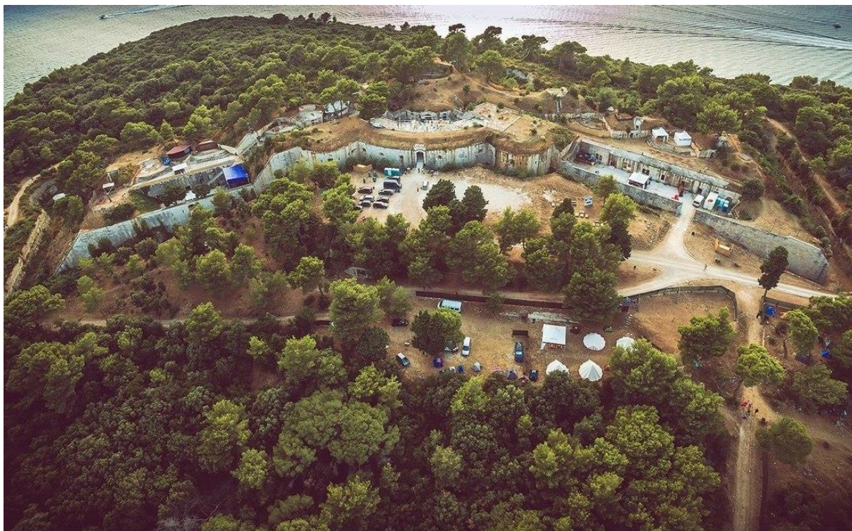
Slika 2 Tvrđava Punta Christo (Daniel Kiršić, 2017)

Izvor: http://seasplash-festival.com/hr/festival/15th-seasplash-2017/objavljeni-datumi-15-seasplash-festivala-prodaji-prve-ulaznice/