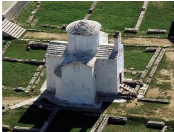
Slika 4. Crkva sv. Križa u Ninu