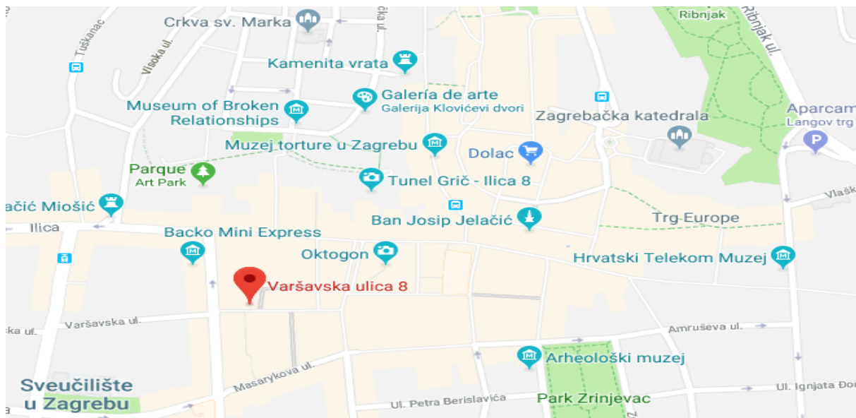
Slika 16: Lokacija

Lokacija ima važnu ulogu u poslovanju bilo kojeg poduzeća. Lokacija ovog primjera bit će u samom centru grada Zagreba, točnije u Varšavskoj ulici 8. Spomenuta lokacija je dostupna svima. U samoj blizini objekta nalazi se Cvjetni trg. Dakle protok ljudi je velik, pogotovo u ljetnoj sezoni. Na odabranoj lokaciji uređena je cjelokupna interna infrastruktura (struja, voda i kanalizacija). Prednost lokacije je da se nalazi u prometnom dijelu grada. Prostor ima 80 m 2 zatvorenog prostora koji je podijeljen na dvije zasebne prostorije od kojih je veća ona za kuhinju. Postoji i mali prostor za postavljanje stolica i stolova kako bi gosti mogli pojesti arepe u lokalu.