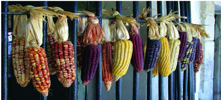
Slika 10: Različita vrsta kukuruza

Arepe su Indijanci pripremali i konzumirali još od vremena prije Kolumba na trenutnim teritorijima koji pripadaju Venezueli. Autohtoni prehrambeni običaji viđeni su u kreolskim jelima na bazi kukuruza poput arepe. Uvođenje arepe u njihova sela rezultat je klime i proizvodnje kukuruza koji je bio važan element u prehrani južnoameričkih starosjedilaca. U tim je krajevima uzgoj kukuruza bio raznolik. Na teritoriju koji odgovara današnjoj Venezueli, plemena su uzgajala devet vrsta kukuruza. Riječ arepa potječe od autohtone riječi "erepa", koju su Cumanagotosi 54 koristili za imenovanje kukuruza. Prema drugoj verziji, riječ arepa mogla je potjecati od "aripo", svojevrsnog blago zakrivljenog tanjura, napravljenog od gline, koji su Indijanci koristili za kuhanje tijesta od kukuruznih brašna. 55