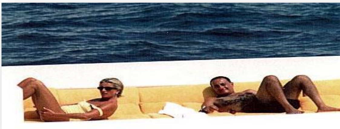
Slika 4 princeza Diana i Dodi na jahti

naslovnice preplavile fotografije rođendanske zabave koju je pripremio za Camillu, Diana je uzvratila šetnjom po plaži u bikiniju, svjesna da ju snimaju paparazzi, a namjerno je dopustila i da snime poljubac koji su ona i Dodi razmijenili na Sardiniji.