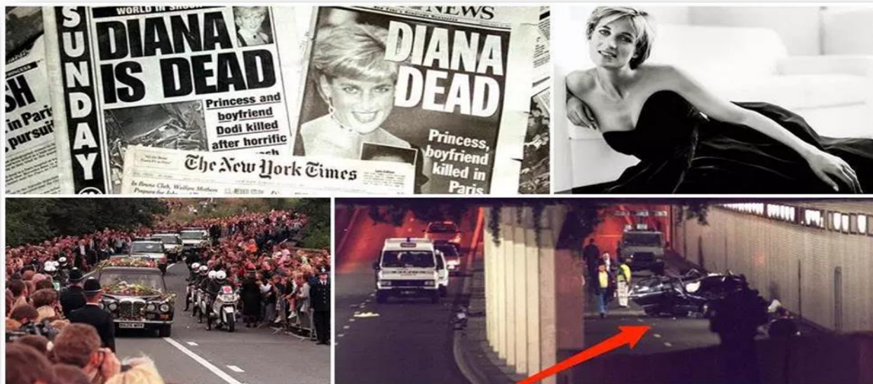
Slika 6 Novinski članci o smrti princeze Diane

Prvo izvješće pokazalo je kako je vozač bio pijan i na drogiran. Njegova obitelj ne vjeruje u to jer nikada nije pio navode mediji 137 .