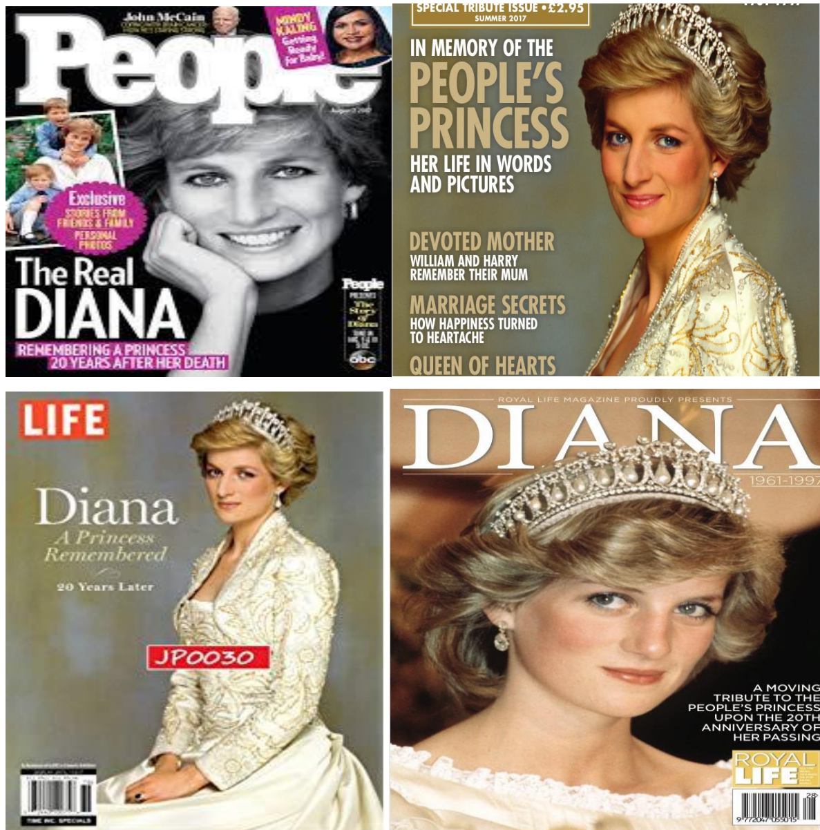
Slika 9 Novinske naslovnice prisjećanja na princezu Dianu