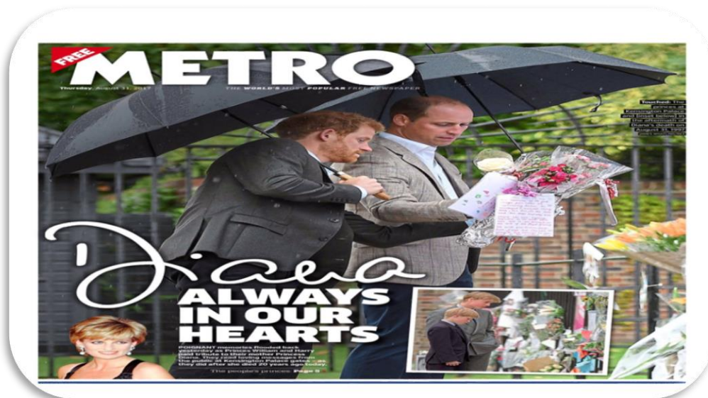
Slika 10 Naslovnica prisjećanja Dijanine smrti

Iako mediji narativ o slavnoj osobi u određenoj mjeri mijenjaju nakon njene smrti, to se isto ne događa s komentarima. Komentari su konstanta koju nije lako, ili uopće moguće promijeniti. Slojevitost, raznovrsnost te ambivalentnost koje slavnju osobu prate u životu uz nju se vežu i nakon njene smrti, tj. oni koji su za života poštovali lik i djelo određene slavne osobe to će činiti i kada osoba premine, i obrnuto.