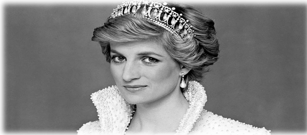
Slika 1 Potret slike princeze Diane