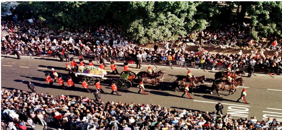
Slika 8 Medijska popraćenost sprovoda princeze Diane