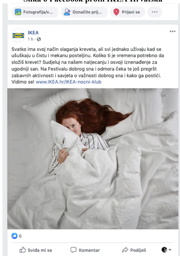
Slika 6 Facebook profil IKEA Hrvatska