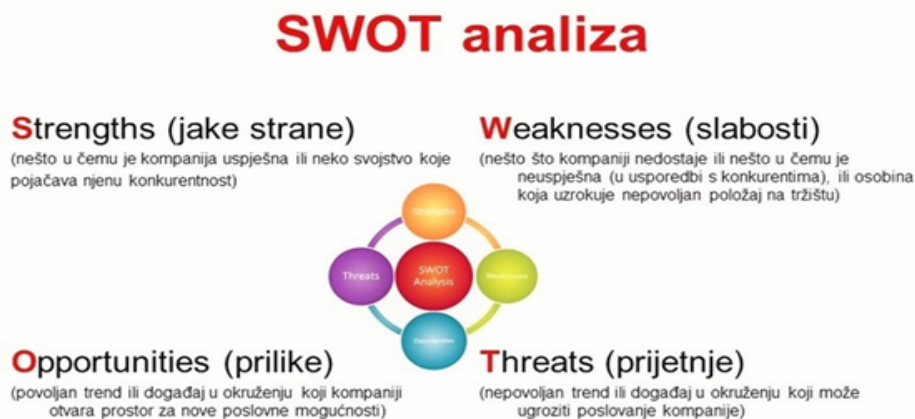
Slika 4 SWOT analiza - struktura