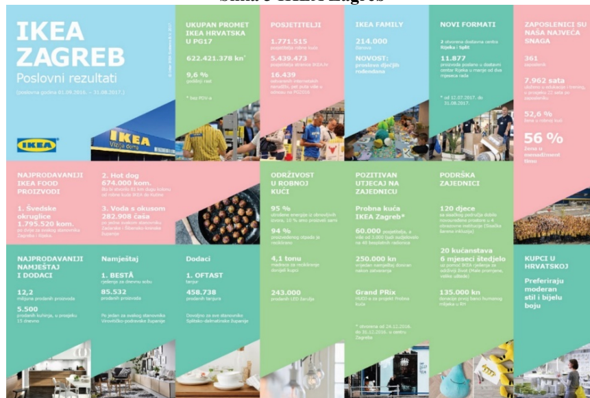
Slika 3 IKEA Zagreb