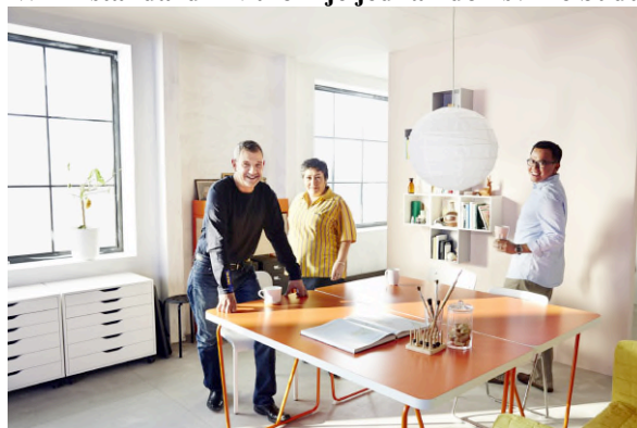
Slika 2 IWAY standard - Nitko nije jednak dok svi ne budu jednaki

IKEA je poznata je po tome da se trudi uspostaviti dugoročne odnose sa svojim klijentima, partnerima, dobavljačima, zastupnicima i distributerima. IKEA želi da se svi osjećaju dobro u vezi proizvoda koje prodaju i zbog tog razloga su uložili puno u izgradnji dobrih odnosa sa svojim dobavljačima. Postoji oko 500 000 ljudi koji rade za tvrtke koje izravno opskrbljuju IKEA širom svijeta. Poduzeće želi biti sigurno da su svi tretirani pravedno, pa su 2000. godine pokrenuli IWAY, takozvani kod ponašanja IKEA dobavljača. IWAY standard je kodeks ponašanja IKEA dobavljača, igra važnu ulogu u pozitivnom razvoju. Navodi minimalne zahtjeve koji se odnose na okoliš, socijalni utjecaj i radne uvjete. Svi dobavljači obvezni su pridržavati se IWAY-a, u suprotnom ne mogu raditi sa IKEA-om. Dobavljači su također dužni obavljati reviziju vlastitih dobavljača. IWAY standardni zahtjevi uključuju: prevencija dječjeg rada i podrška mladim radnicima, zaštita od prisilnog ili vezanog rada, pravo na nediskriminaciju, pravo na slobodu udruživanja, barem minimalne plaće i naknadu za prekovremeni rad, sigurno i zdravo radno okruženje, sprečavanje onečišćenja zraka, tla i vode i rad na smanjenju potrošnje energije. 20