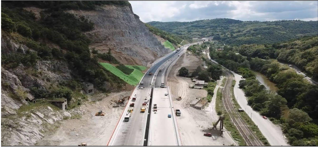
Slika 2. Autoput E - 75

E-75, dionica Caričina Dolina – Vladičin Han, poddionica Caričina Dolina – tunel „Manajle“, Republika Srbija, što je vidljivo na Slici 2.