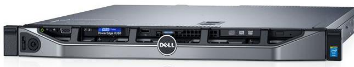
Slika 9 Poslužitelj sa VoIP aplikacijom (VoIP centrala)

Skraćeno od Private Branch Exchange. Pojam predstavlja telefonsku centralu, a u VoIP inačici često se naziva IP PBX, VoIP PBX, Soft Switch ili Call Manager. Radi se o uređaju ili aplikaciji na poslužitelju koji na sebe registriraju IP telefone (ili analogne telefone pomoću pristupnika), te omogućuju međusobnu komunikaciju ili komunikaciju sa vanjskim svijetom preko veza pružatelja javne telefonske usluge. Opisani sustav može se umrežavati sa drugim takvim sustavima, a najpopularniji način povezivanja je pomoću SIP protokola.