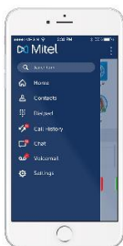
Slika 11 VoIP mobilna aplikacija

Pretstavlja aplikaciju koja se instalira na računalo ili pametnom telefonu i ima funkciju IP telefona. Ako se koristi na računalo potrebno je na istom imati mikrofoni i zvučnik ili slušalice sa mikrofonom. Kao i u slučaju IP telefona navedena klijentska aplikacija može koristiti neki od VoIP protokola, međutim u današnje vrijeme se koristi SIP gotovo bez iznimke.