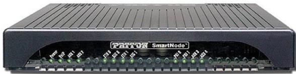
Slika 8 SBC

Ovaj termin se ne prevodi na hrvatski jezik već se koristi u navedenom obliku, a skraćeni je naziv za Session Border Controller. Namjena mu je spajanje dviju SIP strana, SIP stranu pružatelja usluga i SIP stranu krajnjeg korisnika, te manipuliranje pozivima (promjene brojeva, promjene SIP poruka u slučaju nekompatibilnosti između pružatelja usluge i opreme krajnjeg korisnika i sl.). Opisani način rada aludira na to da je SBC u stvari usmjernik, međutim iako spaja dva mrežna segmenta on to nije. Naime, promet s jedne strane na drugu se ne usmjerava IP protokolom nego se svaka strana ponaša kao zaseban uređaj, a paketi se između strana obrađuju i prilagođavaju onoj drugoj strani vlastitim mehanizmima. Uređaj ujedno služi i kao zaštita, budući propušta samo SIP promet i ne vrši funkciju usmjernika, tako da kroz njega ne prolazi podatkovni promet. Uređaj također rješava problem podudarnosti mrežnih segmenata pružatelja usluga i korisnika, jer bez SBC-a ne bi bilo moguće usmjeravati promet prema korisnicima koji koriste iste privatne opsege IP adresa kao što ih koristi pružatelj usluga.