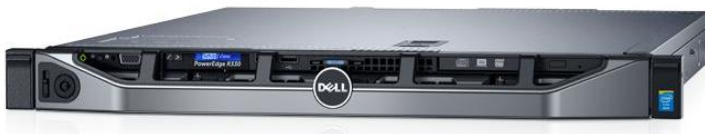
Slika 9 Poslužitelj sa VoIP aplikacijom (VoIP centrala)

Skraćeno od Private Branch Exchange. Pojam predstavlja telefonsku centralu, a u VoIP inačici često se naziva IP PBX, VoIP PBX, Soft Switch ili Call Manager. Radi se o uređaju ili aplikaciji na poslužitelju koji na sebe registriraju IP telefone (ili analogne telefone pomoću pristupnika), te omogućuju međusobnu komunikaciju ili komunikaciju sa vanjskim svijetom preko veza pružatelja javne telefonske usluge. Opisani sustav može se umrežavati sa drugim takvim sustavima, a najpopularniji način povezivanja je pomoću SIP protokola.