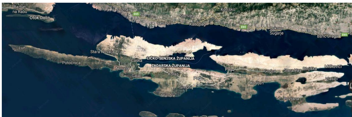
Slika 8 Karta otoka Paga 39

Klima na otoku je mediteranska. Veći dio otoka karakterizira kamenjar koji služi za ispašu koza i ovaca. Sačuvane su šume hrasta medunca i crnike, a na nekim dijelovima se zadržala autohtona zimzelena šikara. U poljima i udolinama (Dinjiško, Kolansko, Povljansko, i Vlašičko) uzgaja se vinova loza, maslina, žitarice, povrće, voće (smokva, badem, breskva). Nadalje, otok je poznat po ovčarstvu i proizvodnji sira, kućnoj radinosti (čipkarstvo) te proizvodnji soli (solane). Mostom kod Posedarja te trajektnim vezama povezan je s kopnom (Žigljen–Prizna) te otokom Rabom. Na otoku se posljednjih desetljeća snažnije razvija turizam. Uz gradove Pag i Novalju veća su naselja: Mandre, Povljana, Kolan, Lun, Stara Novalja, Vlašići i Metajna.