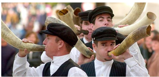
Slika 5 Saljska Tovareća mužika 33

S ciljem daljnjeg održivog razvoja obje gospodarske grane - turizma i ribarstva - potrebno je intenzivnije uključivanje marikulture u turističku ponudu. To može biti putem aktivnog uključivanja turista u djelatnost ribarstva i marikulture – otvaranje muzeja i interpretacijskih