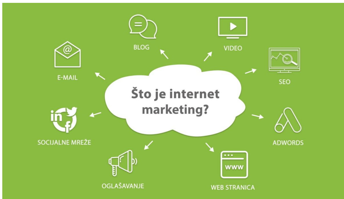
Slika 2 Kanali Internet marketinga