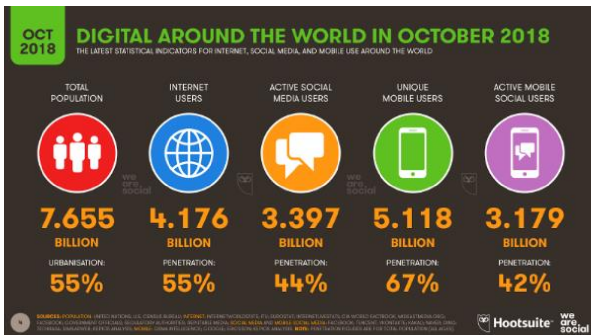
Slika 5 Trendovi korištenja interneta i društvenih mreža u svijetu (Listopad, 2018.)

brzinom. GPS aplikacije nude sve veću količinu informacija. Što više informacija tvrtka pruža Googleu, više će se informacija prikazati na ovim GPS kartama. A takav se posao ne može učiniti sam; često će biti potrebno zatražiti pomoć stručnjaka koji će osigurati vidljivost tvrtke na najvećem mogućem broju web stranica. 19