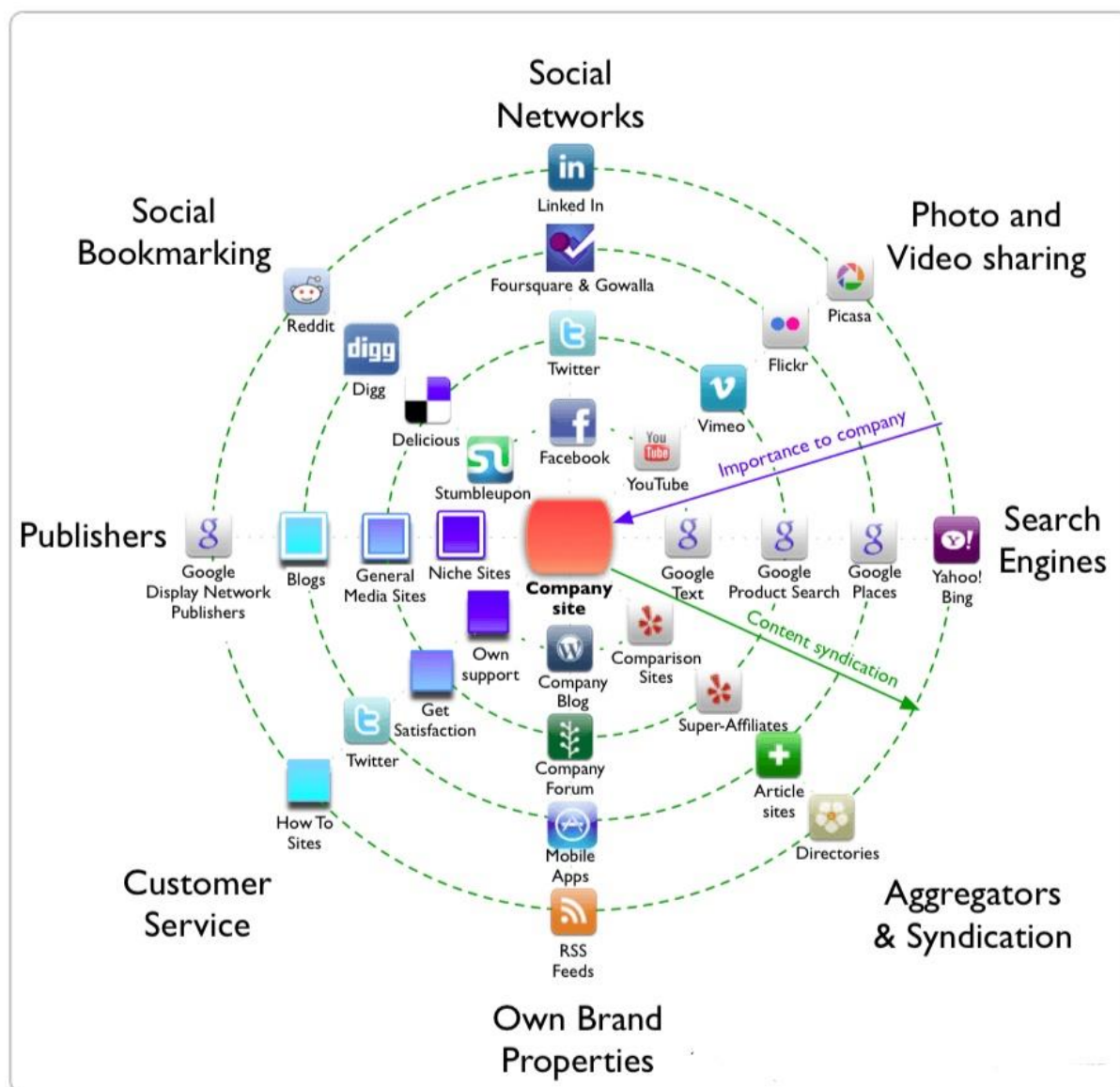
Slika 4 Digitalni marketinški radar