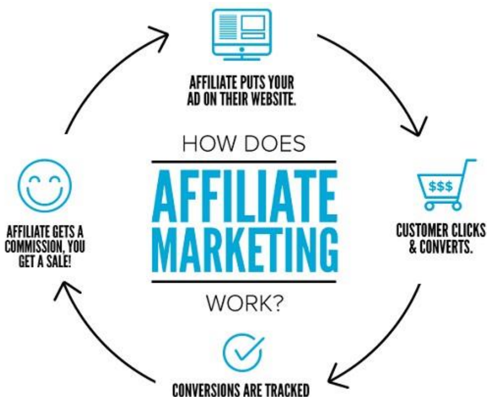
Slika 3 Affiliate marketing